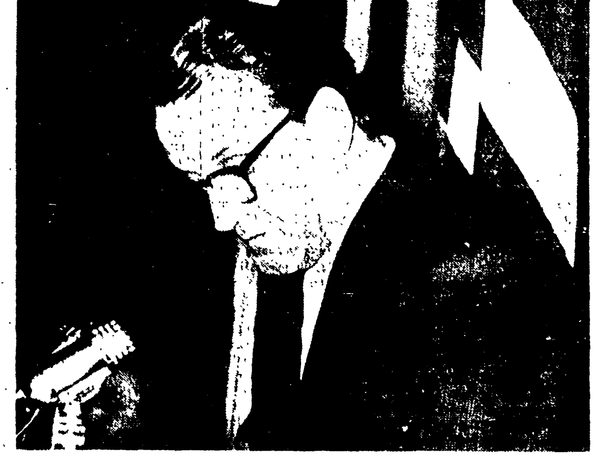
Il barone Renato Cini di Portocannone durante un comizio