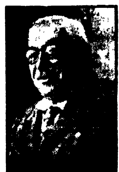
Il capomafia Vizzini