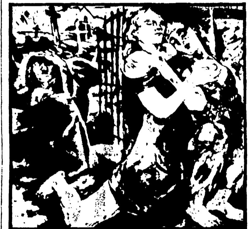
Manifesto per la presentazione di « Ein Geschlecht » di Fritz von Unruh, dato allo Schauspielhaus di Francoforte sul Meno nel 1918. La litografia è conservata a Monaco nel Museo del Teatro

Una lettera-petizione di personalità della letteratura e dell'arte per aiutare il grande autore teatrale antinazista