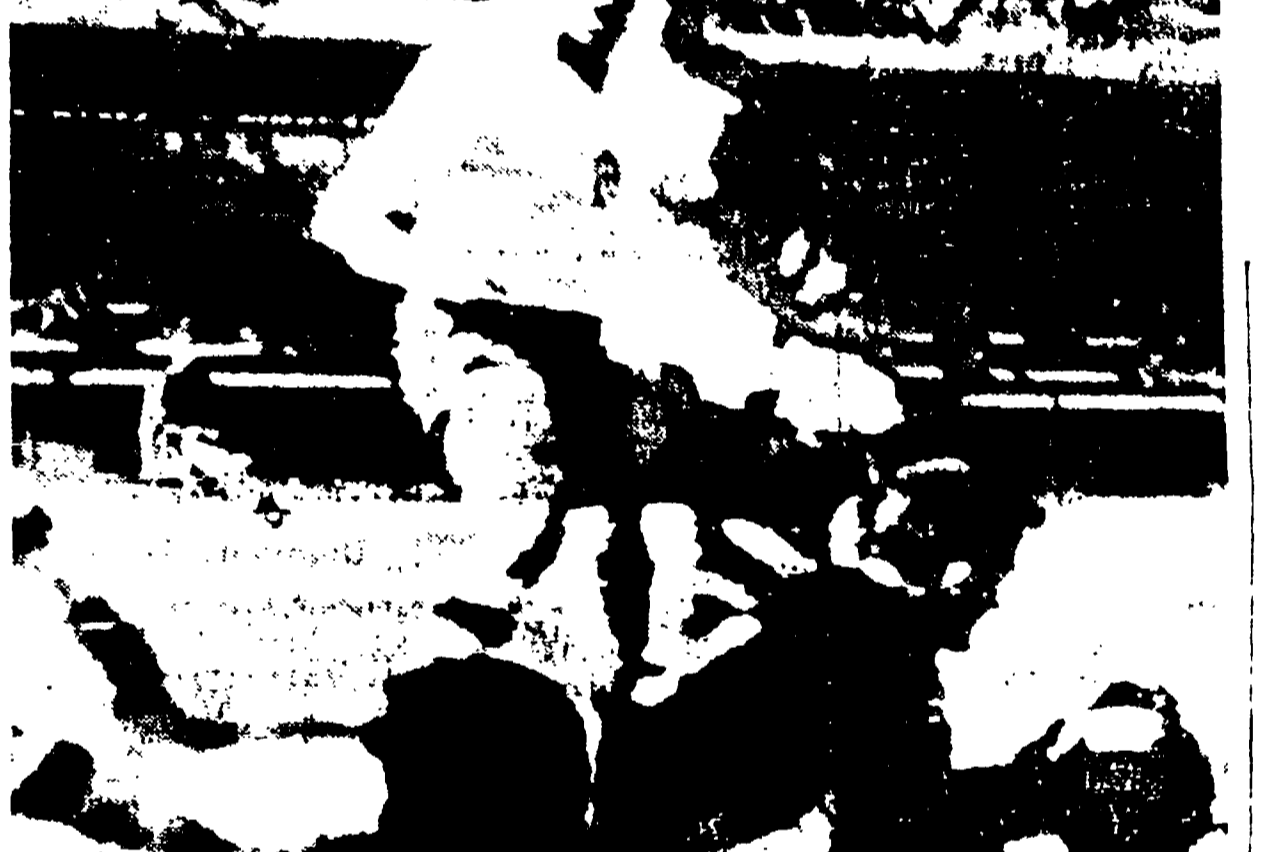
Il portiere jugoslavo SOSKIC interviene sul ceecoslovacco JELINEK.