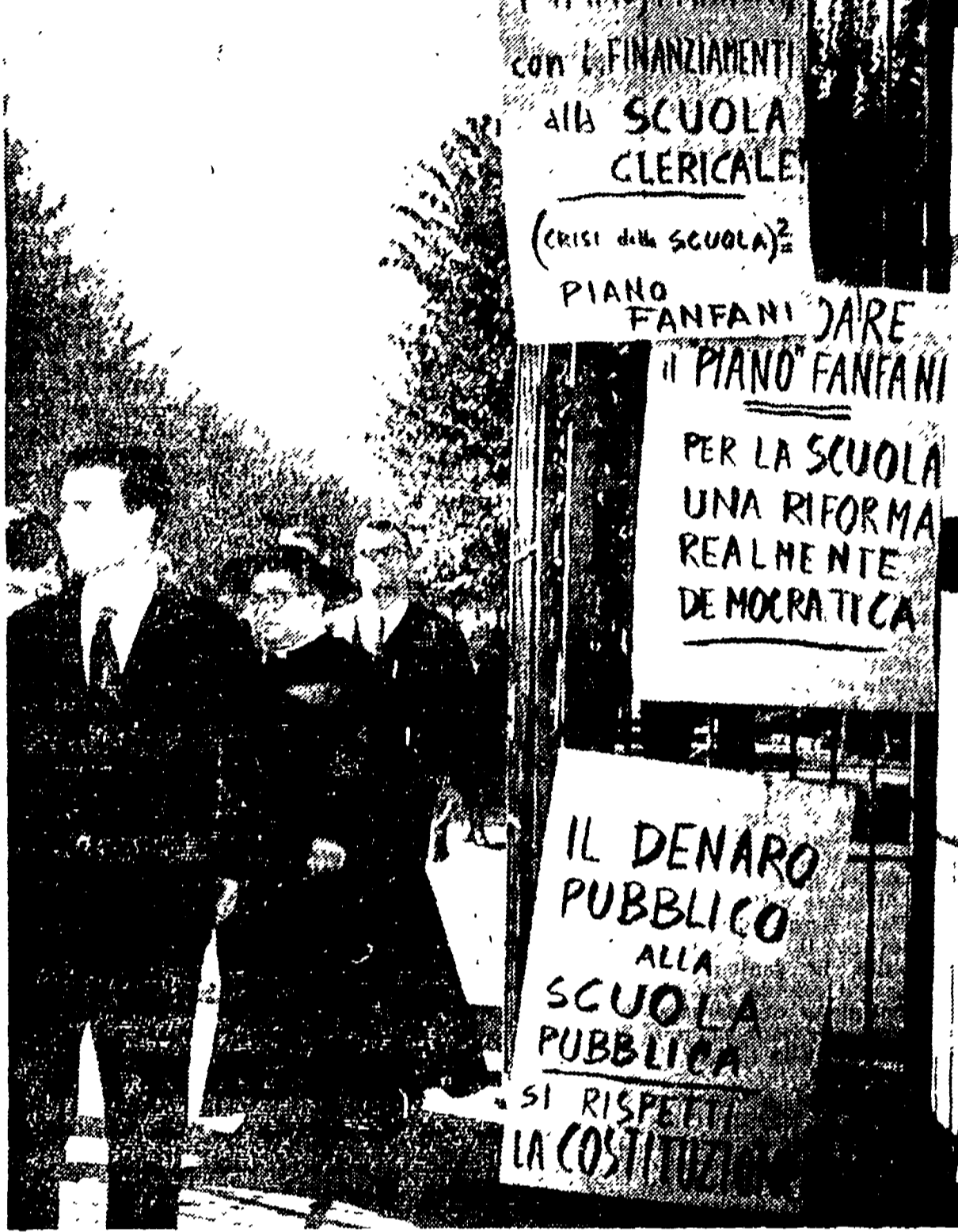
Una manifestazione degli studenti per la difesa e lo sviluppo della scuola pubblica