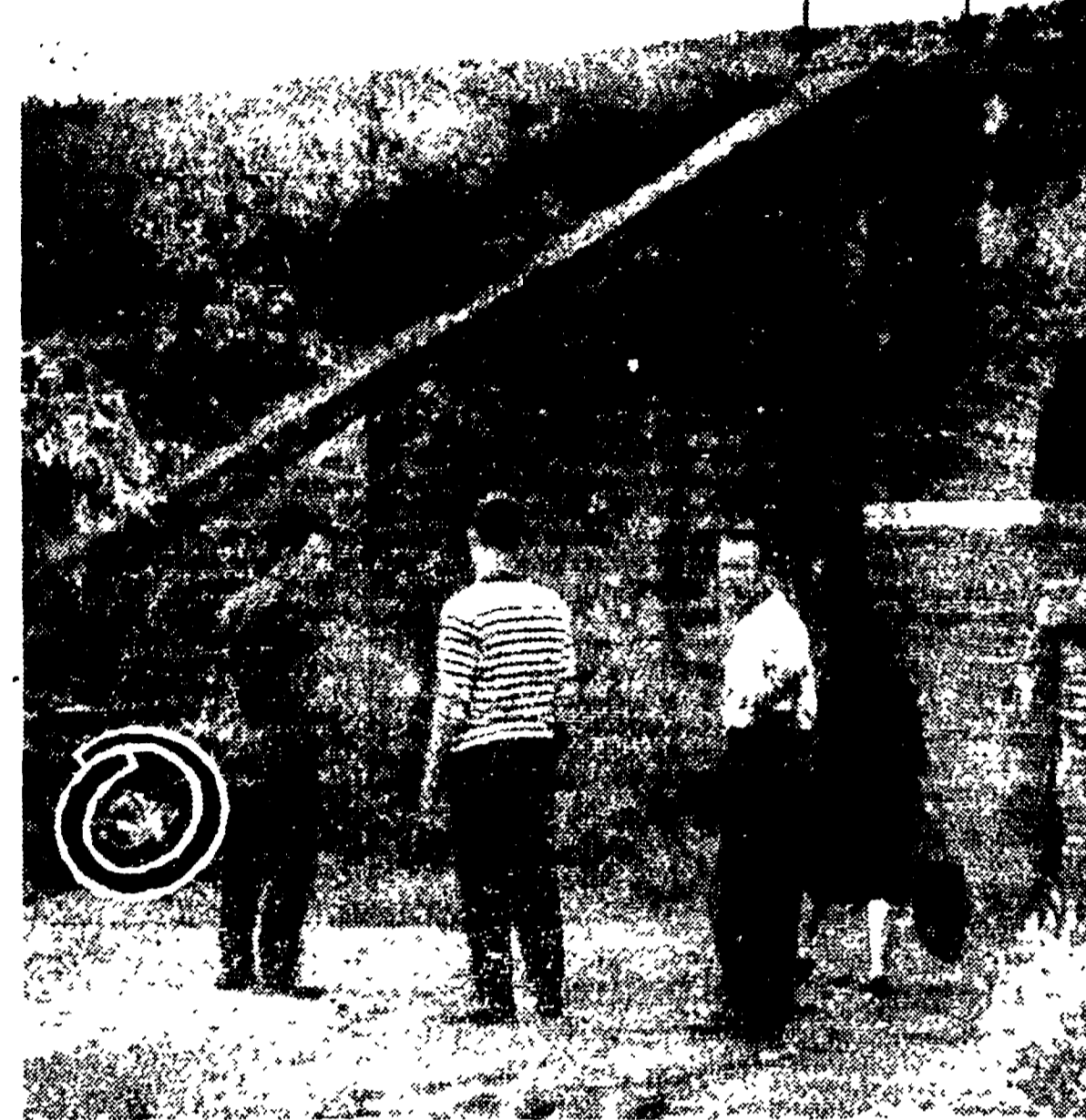
Un feto umano di sesso maschile, quanto al completamento — dai primi accertamenti medico-legali sembra infatti che sia di sette mesi — è stato trovato ieri mattina al Quadraro. Alcuni abitanti della zona, che hanno le finestre sulla linea ferroviaria Roma-Napoli, hanno telefonato ai carabinieri della locale stazione, avvertendoli del macabro ritrovamento fatto da alcuni passanti.