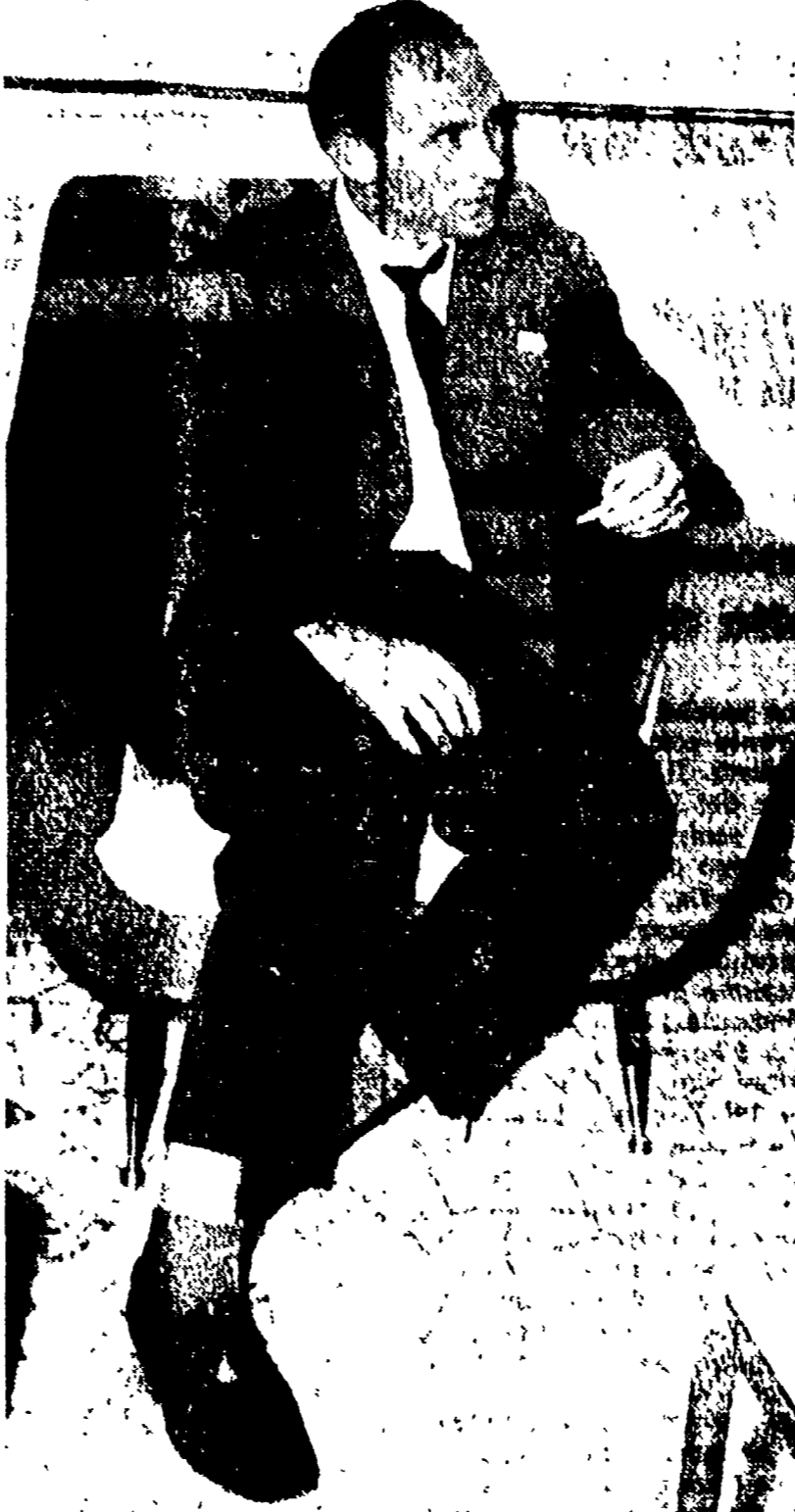
Il poeta spagnolo Marcos Aña fotografato durante la intervista.