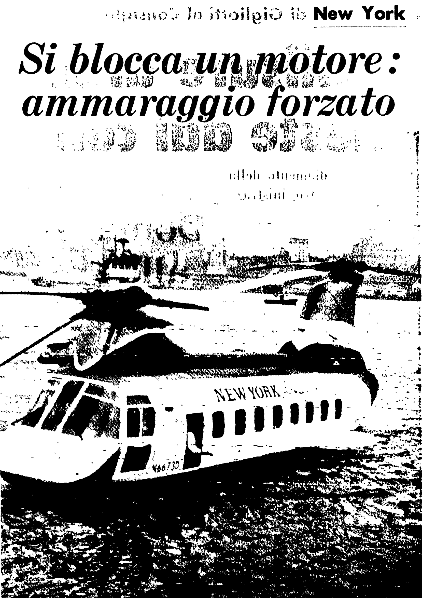
NEW YORK - Un elicottero con 19 passeggeri e tre uomini d'equipaggio è stato costretto a compiere un ammaraggio di emergenza nell'East River. Fortunatamente tutto è finito bene, il pesante macchinario è rimasto a galla e i mezzi di soccorso sono riusciti a trainarlo fino a terra.

La situazione politica dell'Uruguay è molto complessa, e a volte difficile da capire per gli stranieri. E' bene fare le seguenti precisazioni.