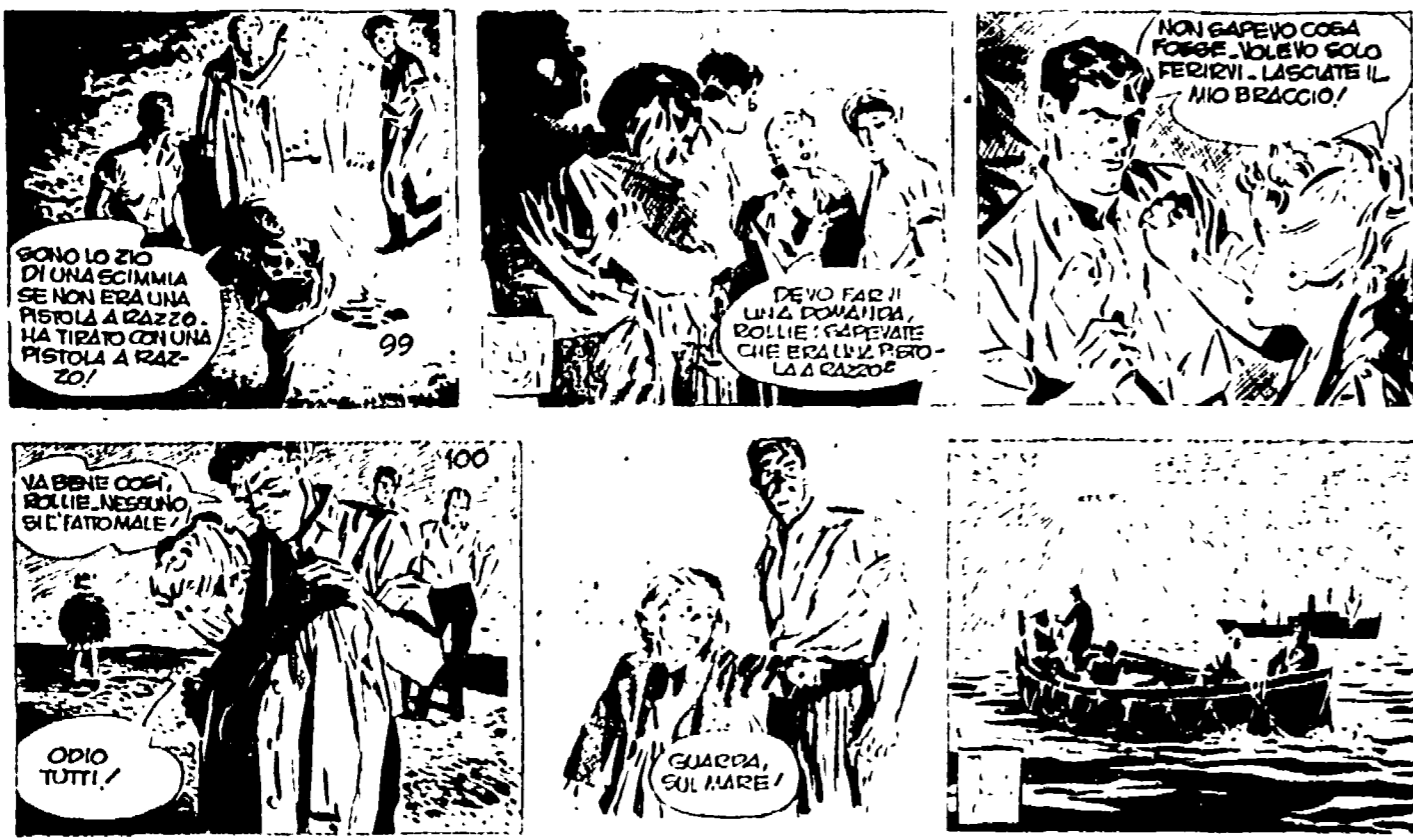
SONO LO ZIO DI UNA SCIMMIA SE NON ERA UNA PERLA... HA TIRATO UNA PISTOLA A RAZZ...