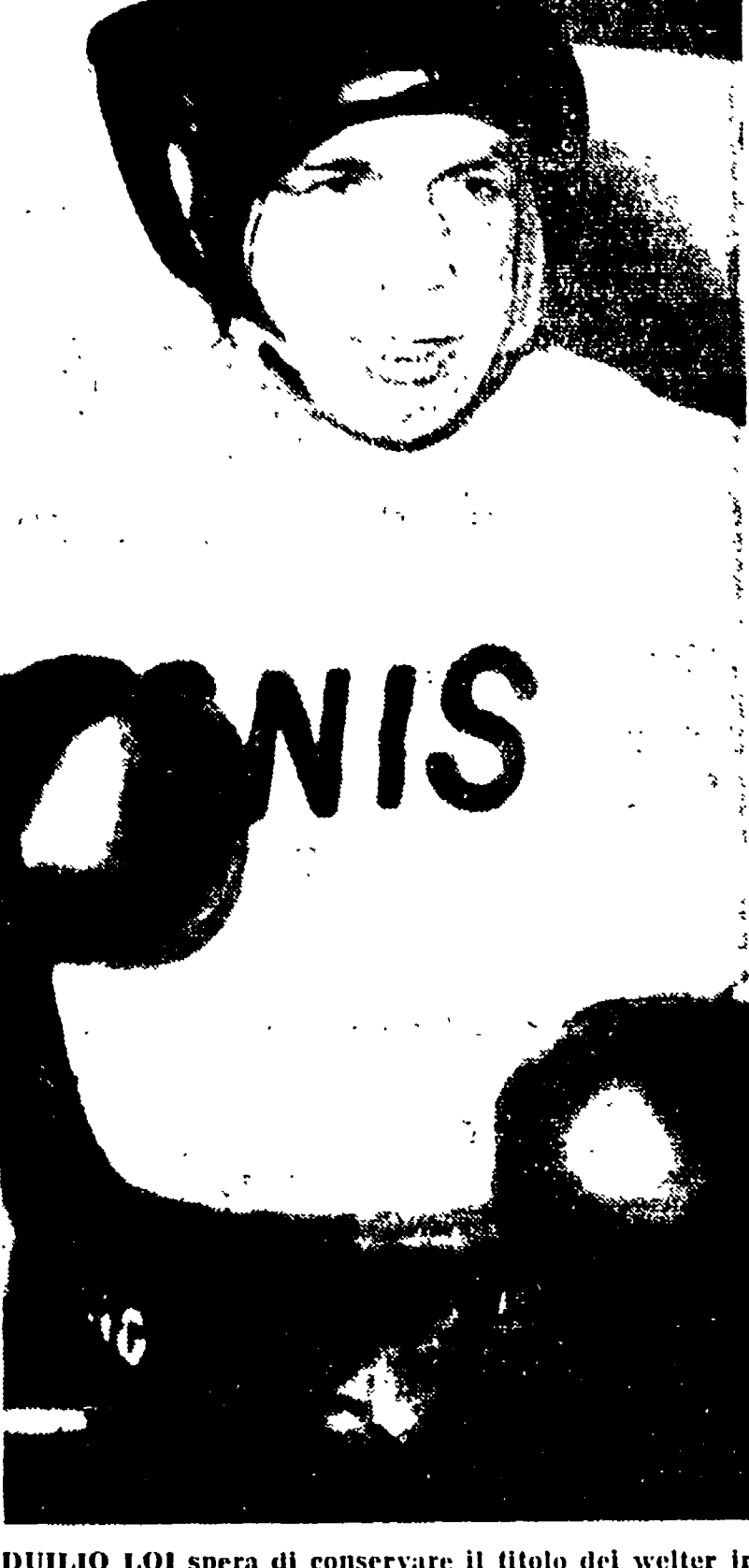
DUILIO LOI spera di conservare il titolo del welter jr. contro EDDIE PERKINS

Il pugilato è un gioco di uomini, di uomini che si battono per un premio. Il pugilato è un gioco di uomini, di uomini che si battono per un premio. Il pugilato è un gioco di uomini, di uomini che si battono per un premio.