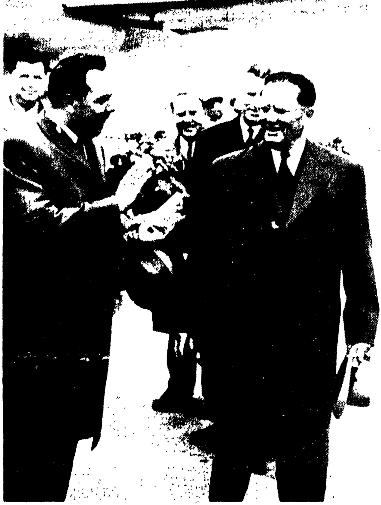
BELGRADO — Breznev (a sinistra) ricambia il benvenuto datogli da Tito, applaudendo all'indirizzo del presidente jugoslavo