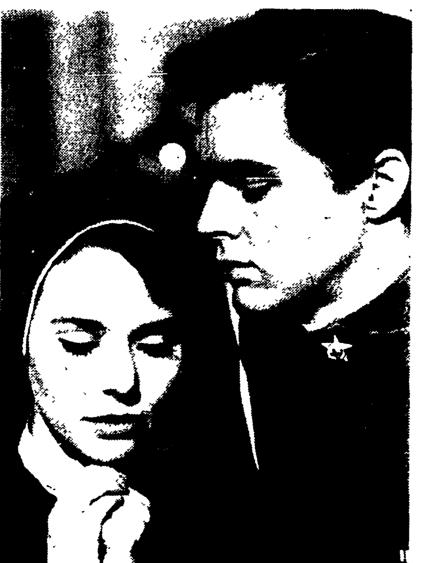
RICHARD BEYMER e SUSAN STRASBERG, due degli interpreti di « LE AVVENTURE DI UN GIOVANE », il Cinema-Scope a colori della 20th Century-Fox. « LE AVVENTURE DI UN GIOVANE », un film dove c'è tutto Hemingway, è ispirato ad alcuni racconti del celebre scrittore americano.