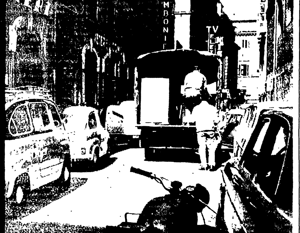
A DEL GAMBERO ORE 10 - Un negozio di elettrodomestici aveva urgente bisogno di lavatrici. Il camioncino è costretto a fermarsi in mezzo alla strada, praticamente bloccando la circolazione. Accurrerà il vigile con il bicchieretto delle multe. Non fa nulla: nella bolletta che accompagna la merce, dopo l'IGE, sono calcolate le mille lire per la contravvenzione