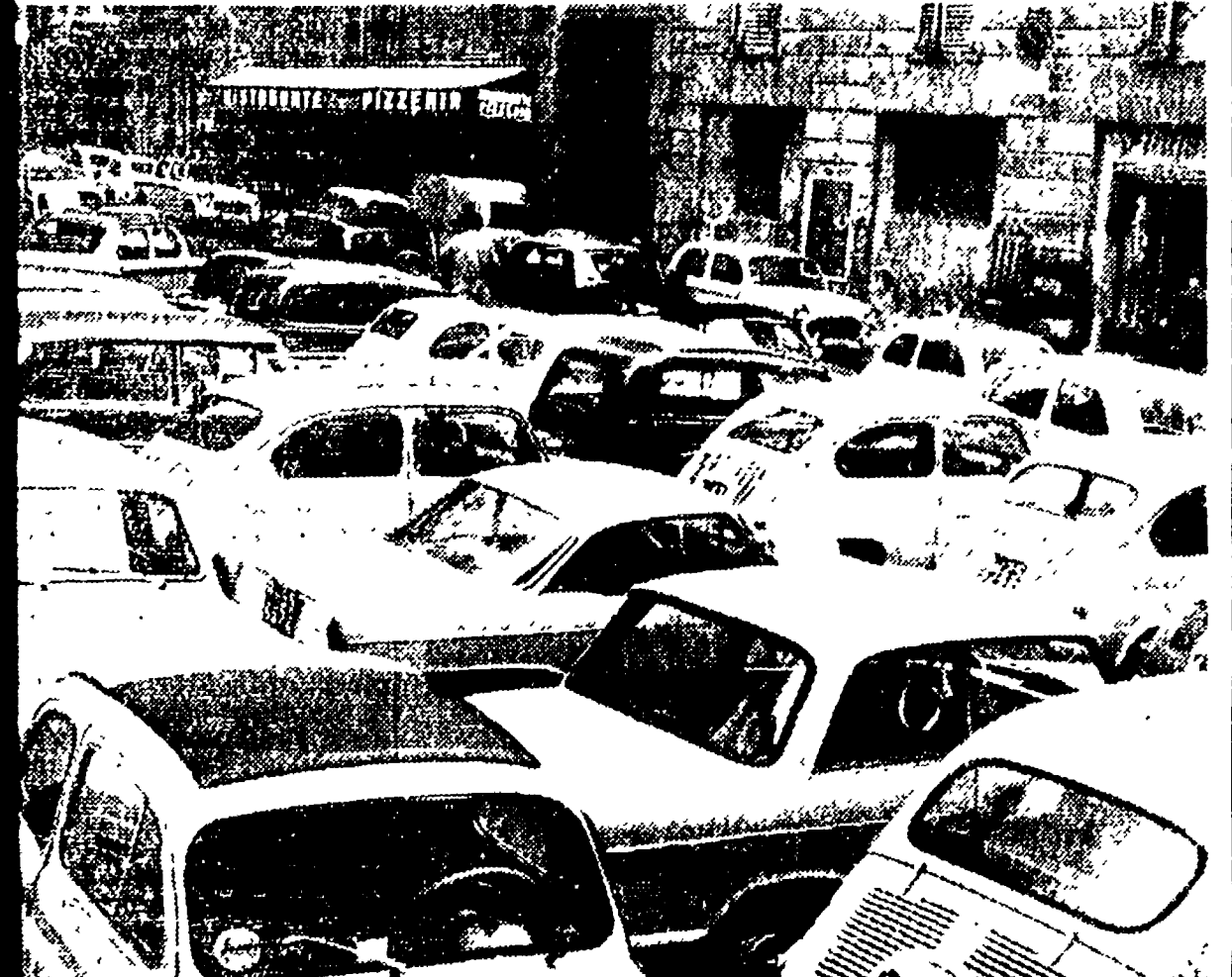
PIAZZA DELL'ORATORIO ORE 10 - Non esiste più un solo centimetro quadrato libero. E' possibile solo muoversi in un senso lungo via dell'Unità. Un'auto che ferma in cerca di un posto blocca di colpo decine di automobili

ta un palmo. Siccome le macchine sono posteggiate sui due lati, un camioncino s'era aperto la strada senza tanti complimenti.