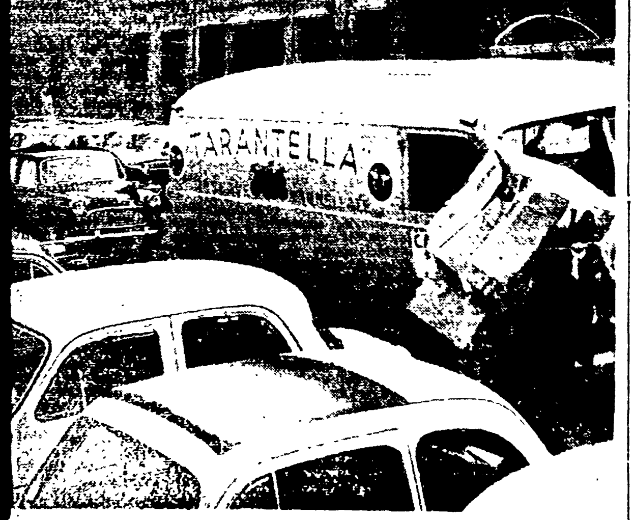
PIAZZA DEL COLLEGIO ROMANO ORE 10 - Parcheggio sullo sfondo, parcheggio in primo piano: nel centro lo stretto sentiero che permette il passaggio di una sola automobile. Chi procede in senso inverso deve attendere che il viottolo sia libero prima di attraversare la piazza

La «fame di spazio» che tormenta gli automobilisti del centro ha creato per tutti mille nuovi problemi. Chi rimane fuori del giro si arrangia come può, lasciando la macchina in una strada qualsiasi, ad un pelo dal Corso. L'altro giorno ho lasciato la macchina in via della Panetteria - e ci ha detto un impiegato - quando sono andato a riprenderla la fiancata era abbozzata in più punti e la vernice era stata scrostata dal fango alla coda. La strada era fat-