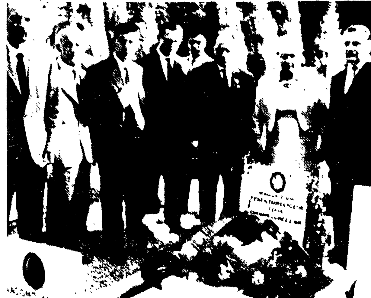
GENOVA — Una parte della delegazione del PCUS ha reso ieri omaggio alla tomba del partigiano sovietico Poetan, medaglia d'oro al valor militare caduto durante la guerra di Liberazione, unica riconoscenza italiana concessa ad un cittadino straniero. Nella foto: i membri della delegazione dinanzi alla tomba del partigiano