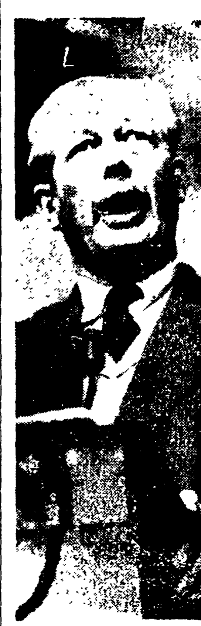
LONDRA — Macmillan alla tribuna del Congresso.

LONDRA, 14. Il Congresso del partito conservatore a Llandudno si è concluso pronunciandosi nettamente in favore dell'ingresso della Gran Bretagna nel MEC.