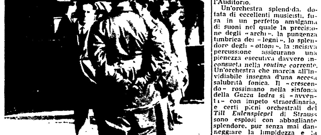
In occasione della festa delle forze armate, ieri tutte le caserme sono state aperte al pubblico. Centinaia e centinaia di bambini hanno preso d'assalto i carri armati e i cannoni ed hanno soddisfatto tutta la loro curiosità sbucando di domande i soldati messi a loro disposizione per tutto il giorno.

L'Orchestra filarmonica ceca di Praga mantiene intatta l'antiana tradizione di prestidivino discende, infatti, dal prestigioso complesso orchestrale costituito nel 1860 e che nel 1902 si consolidò come autonomo e moderno strumento di musica sinfonica. L'Orchestra dell'Accademia di Santa Cecilia, quest'orchestra ha fatto subito centro nella stima degli appassionati che affollavano ieri l'Auditorium.