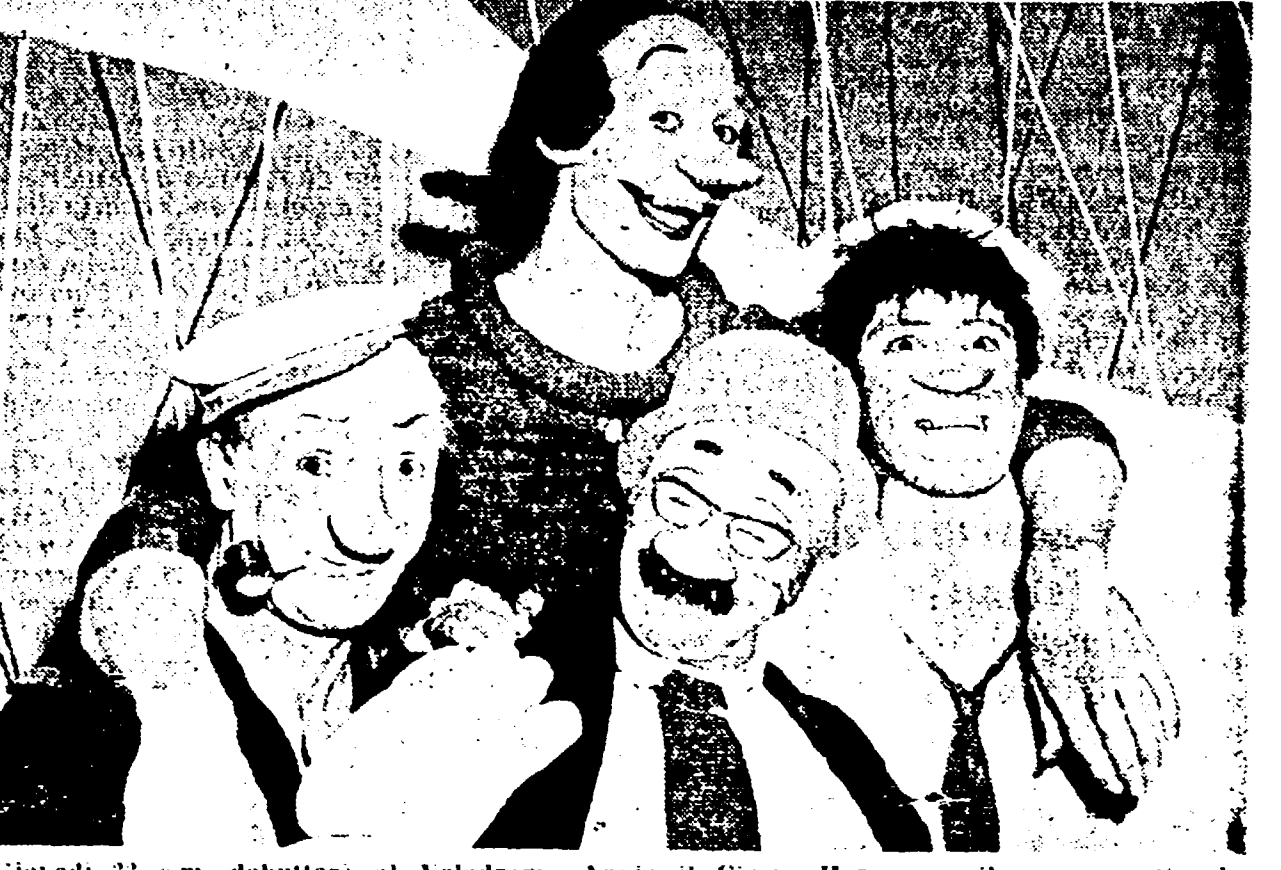
Giovedì 22 cm. debutterà al Velodromo Appio il Circus Heros con il nuovo spettacolo 1962-63. Tra le attrazioni: il famoso salvatore (nella foto) notissimo ai telespettatori italiani per le loro felici apparizioni nella rubrica televisiva «Tutti in pista».