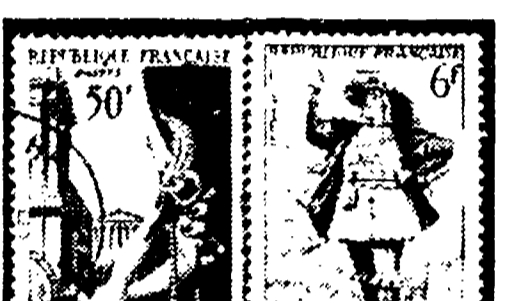
1954 - n. 11 (8-12) blu, violetto e verde