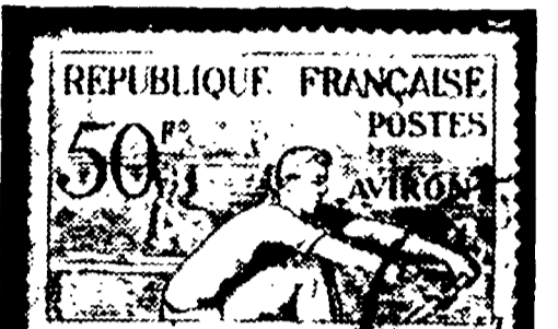
1953 - n. 5 (1-6) verde smeraldo