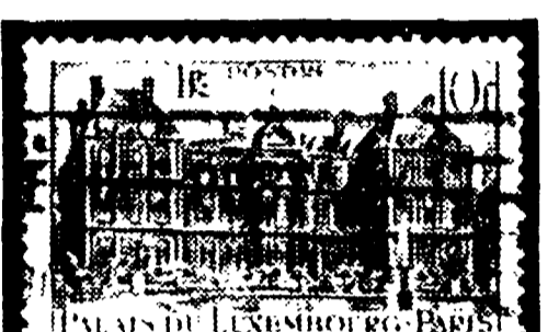
1946 - n. 7 blu chiaro