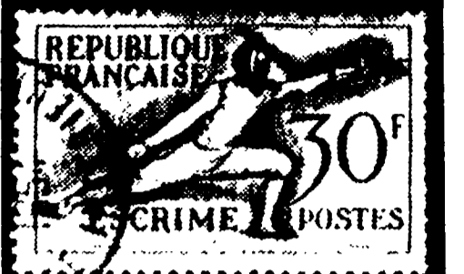
1953 - n. 3 (1-6) violetto e grigio

Un amico filatelista di Milano, ci scrive: «Sono molti che fanno collezione ma che non possiedono un catalogo, né potranno permettersi di comprarlo; la richiesta per loro è molto difficile. La «vetrina-catalogo», quindi, può, perché non trasformarla anche in catalogo?». Abbiamo accolto la proposta e, da questa settimana, diamo a tutti i nostri piccoli amici la possibilità di costruire un catalogo con le loro mani, incollando le nostre riproduzioni e le indicazioni su dei quaderni. Sotto ciascun francobollo indichiamo il numero di catalogo e, naturalmente, il numero di francobolli che appartiene ad una serie; l'anno di emissione ed infine il colore. I nostri piccoli amici sprovvisti