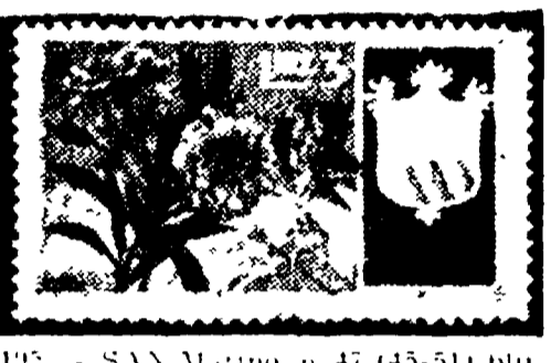
1955 - SAN Marino n. 47 (45-51) blu.