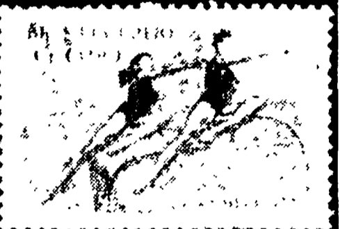
1955 - Biellese n. 41 (45-51) blu.