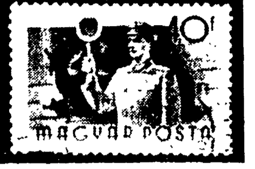
1955 - Ungheri n. 18 (13-32) bruno.

Insieme a noi, i nostri giovani amici possono continuare a costruire il catalogo...