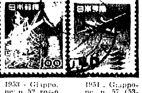
1953 - Giappone n. 52, rosso-bruno. 1951 - Giappone n. 55 (53-55) grigioazzurro.