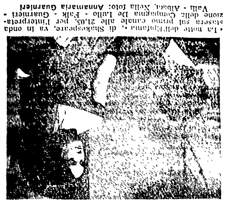
Nella foto: Annamaria Guarnieri - Stasera sul primo canale alle 21,05, per l'interpretazione di "L'età di Stalin", di Stasera, in un'onda di luce.