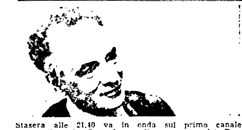
Stasera alle 21,40 va in onda sul primo canale un servizio da Stoccolma sulla consegna dei Premi Nobel 1962. Nella foto: lo scienziato sovietico Lev Davidovic Landau, Premio Nobel per la fisica.