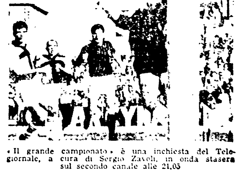
«Il grande campionato» è una inchiesta del Telegiornale, a cura di Sergio Zavoli, in onda stasera sul secondo canale alle 21,05.