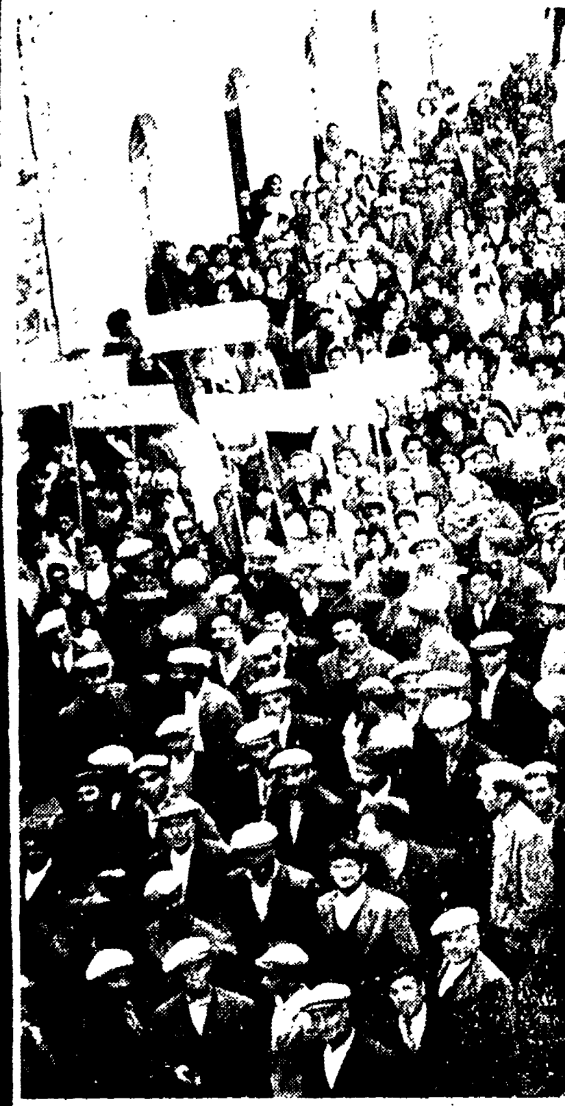
Nelle campagne meridionali...

L'incontro avrà luogo oggi - I programmi in difficoltà