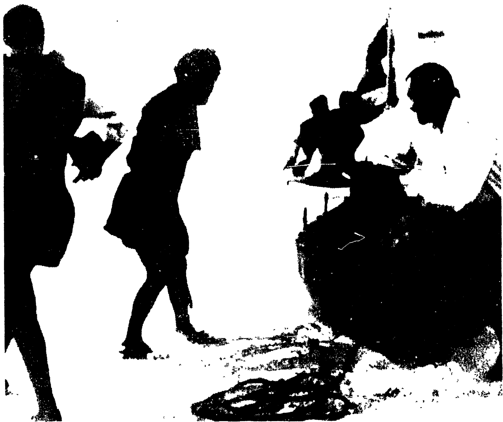
SAN SALVADOR — L'equipaggio della caravella «Nina II», copia fedele di una delle unità con le quali Cristoforo Colombo sbarcò a San Salvador nel 1492, è sceso a terra dopo 76 giorni di navigazione, (alcuni in più di quelli impiegati dal genovese), durante i quali ha ripercorso la rotta seguita dal grande navigatore. Nella foto: i membri dell'equipaggio sbarcano da una scialuppa con la bandiera che fu di Colombo; sullo sfondo la «Nina II»