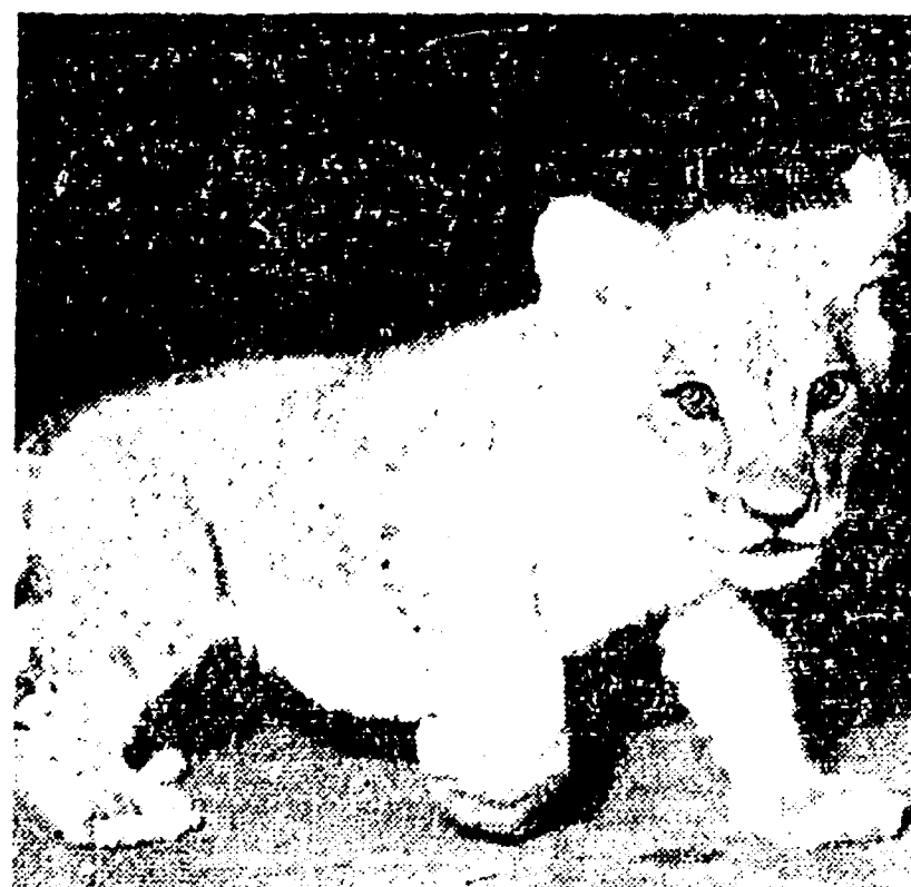
Colpo a grosso: al circo Heros, hanno rubato un leoncino. I ladri sono penetrati di notte sotto il grande feldone alzato negli scorsi giorni in piazza Antonio Manno, al quartiere Flaminio, entrando poi nella gabbia degli otto leoncini nati tre mesi fa. Hanno portato via l'esemplare più bello. Per loro fortuna nella gabbia non c'era madre leonessa; proprio in questi giorni era stata trasferita per lo svezzamento dei cuccioli. Ora gli agenti del commissariato Porta del Popolo stanno ricercando i ladri e... leoncini.

Ha riportato gravi ustioni al viso e alle spalle