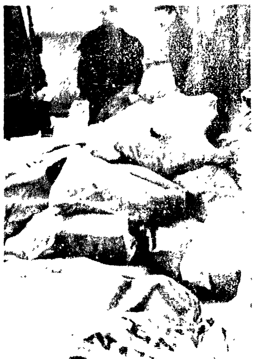
PARIGI — Centinaia e centinaia di sacchi di corrispondenza (che probabilmente contengono in gran parte auguri di Buone feste) giacciono invasi alla stazione centrale, la Gare de Lyon, per lo sciopero di 21 ore dei postelegrafonici.