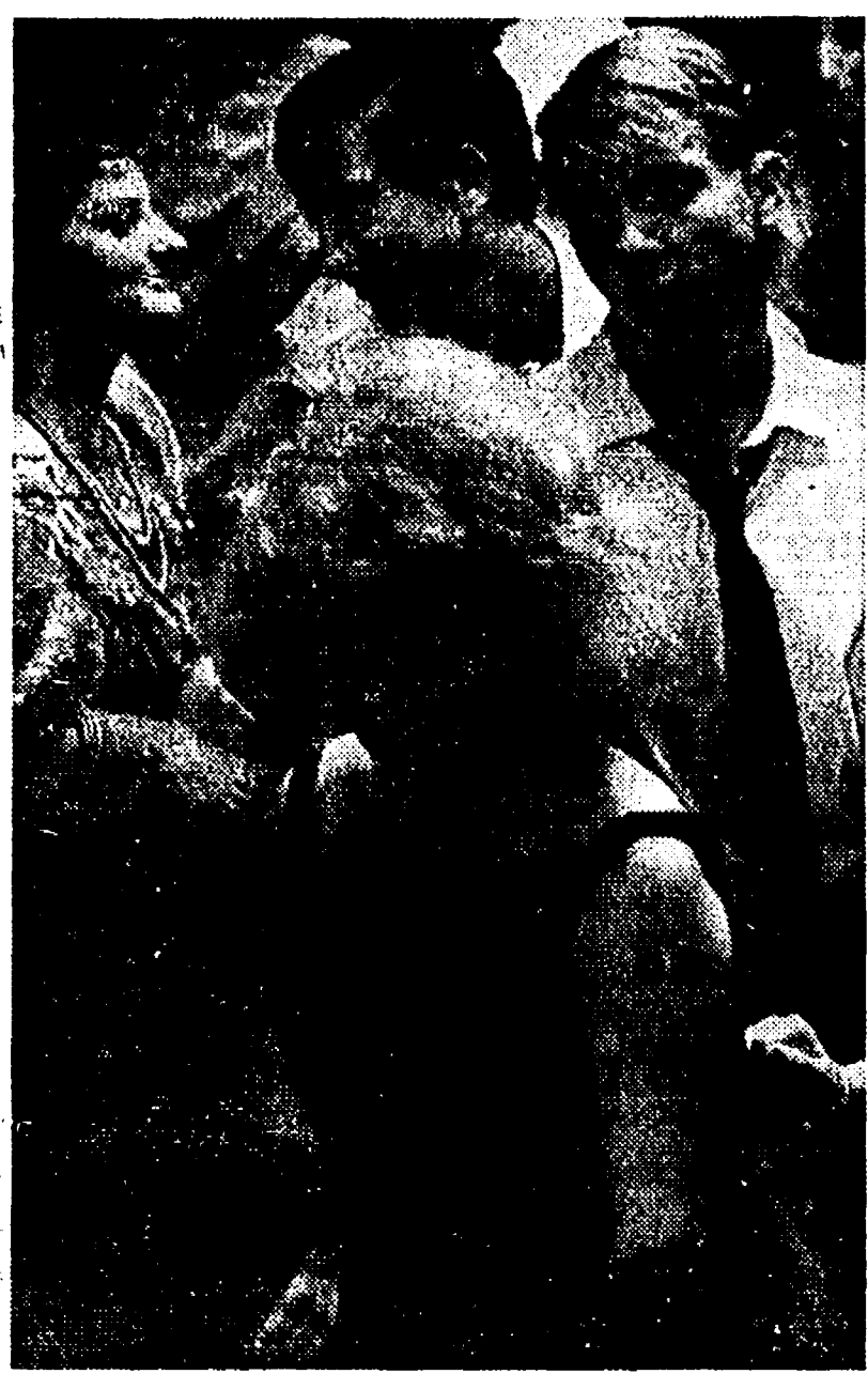
« UOMO O DONNA? LA DIFFERENZA DEI SESSI SI E' FATTA SEMPRE PIU' INCERTA » (da « La vita provvisoria »)

UNA NUOVA TAPPA NELLA STORIA DELLO SPETTACOLO CINEMATOGRAFICO