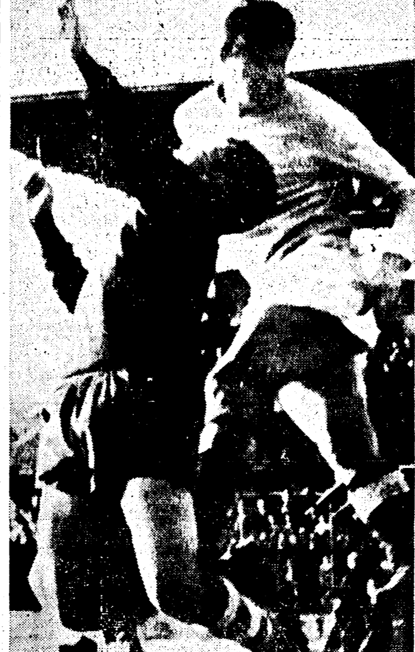
PRO PATRIA-LAZIO 0-0 — ROZZONI insidia di testa il portiere bustocco.