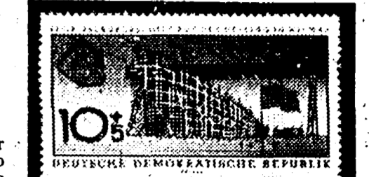
1960 - Repubblica Democratica Tedesca n. 302 (301-304) nero, giallo bruno e rosso.