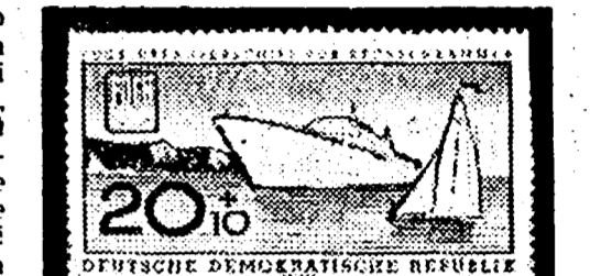
1960 - Repubblica Democratica Tedesca n. 304 (301-304) nero, rosso e azzurro.