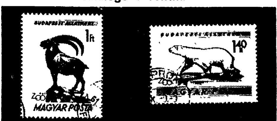
1961 - Ungheria, numeri 295, 296 (291-300) colori blu, verde e bruno, blu e grigio.

Pro memoria Ricordiamo a tutti i nostri amici di indirizzare sempre a "l'Unità" (lettere) via dei Taurini, 19.