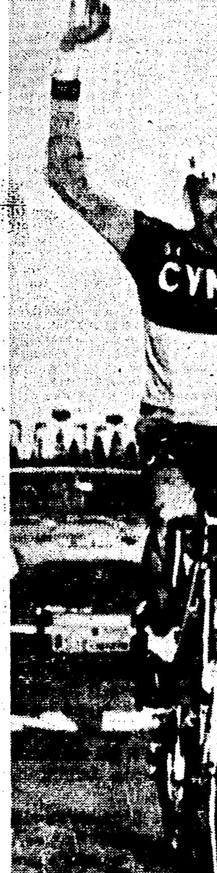
Battuta la Roma (19-6)