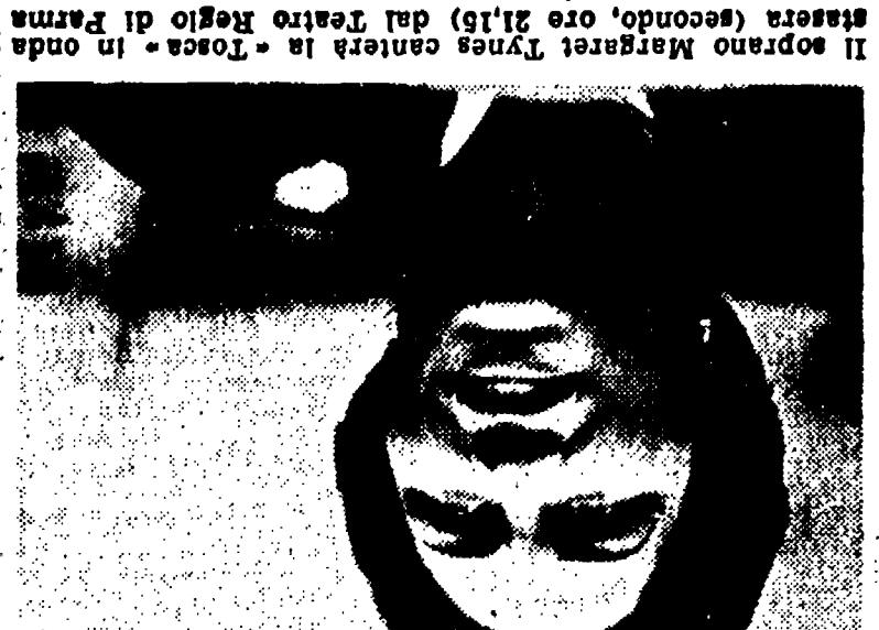
Il soprano Margaret Dymally canta in «Tosca» in onda lunedì 7 marzo.

La fortuna viene dagli stadi La puntata di questa sera della serie «Terzo» (primo canale, ore 22.45) è dedicata alla «Terza» (primo canale, ore 22.45) e dedicata alla «Terza» (primo canale, ore 22.45).