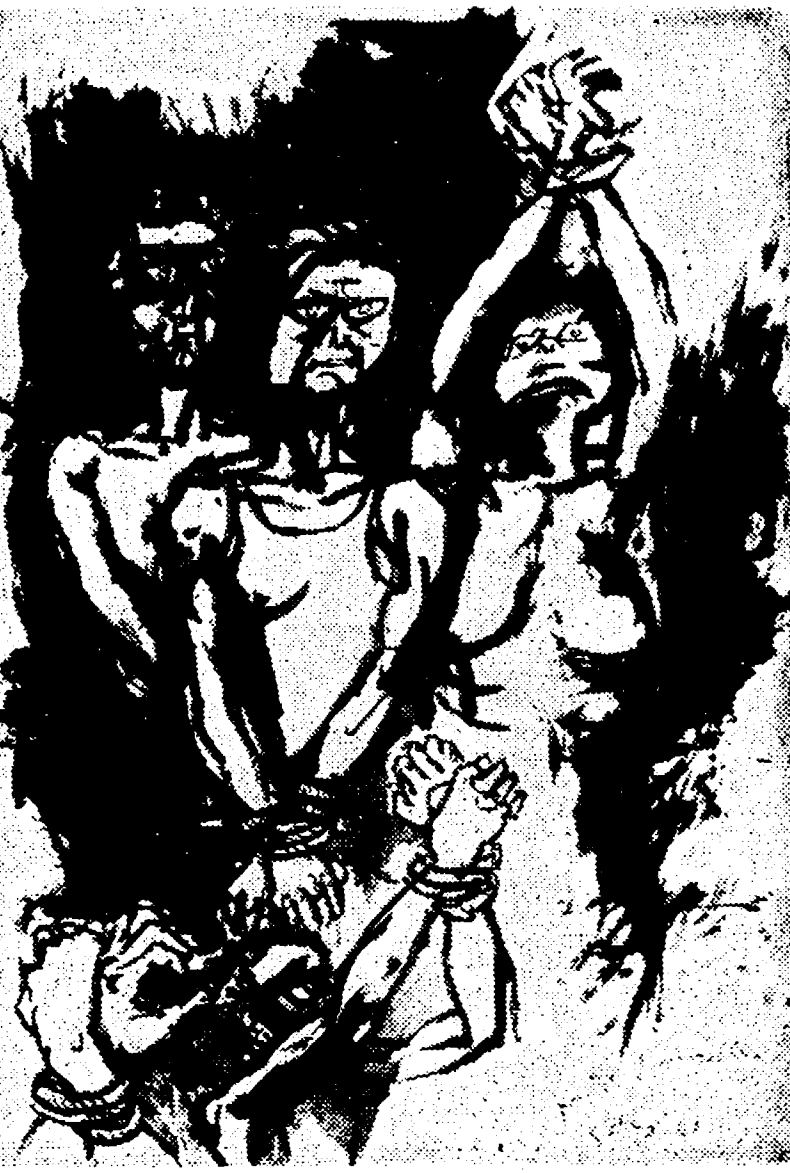
Leri presso la Libreria Einaudi si è aperta la mostra di pittura « Omaggio dei pittori italiani alla Resistenza portoghese », presenti numerose personalità del mondo artistico, culturale e politico. Lo scrittore Giancarlo Vigorelli ha illustrato il significato della manifestazione, mentre Elvy Lissiak ha letto alcune liriche di poeti portoghesi. Infine Franco Portone, del Comitato per le libertà democratiche in Portogallo ha ringraziato gli oltre 70 pittori che hanno inviato quadri. Nella foto: il quadro di Guttuso.

da domani nelle edicole il primo fascicolo