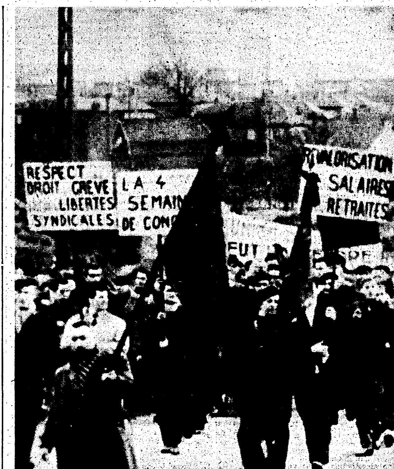
Manifestazione di minatori che issano cartelli con le loro rivendicazioni