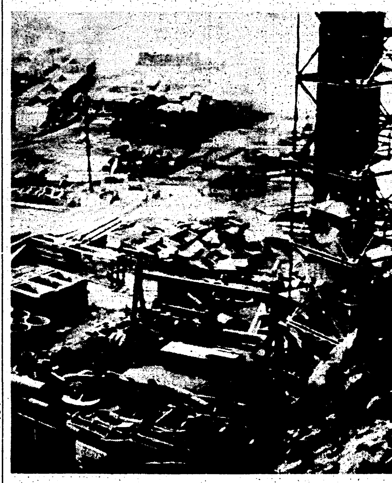
Una veduta dall'alto di una miniera deserta per lo sciopero