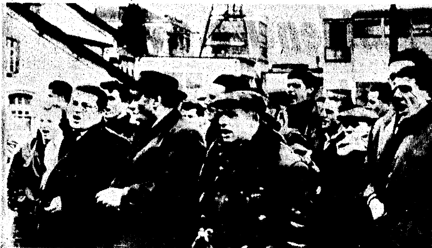
MERLEBACH — Un momento della manifestazione dei minatori davanti agli uffici della direzione

«La disfatta del 1948 aveva lasciato tracce profonde; per 15 anni i minatori avevano rifiutato di scendere in lotta - Questa volta la pressione nasce dal basso e dalla convinzione unitaria e radicata che si tratta di difendere un vitale interesse »