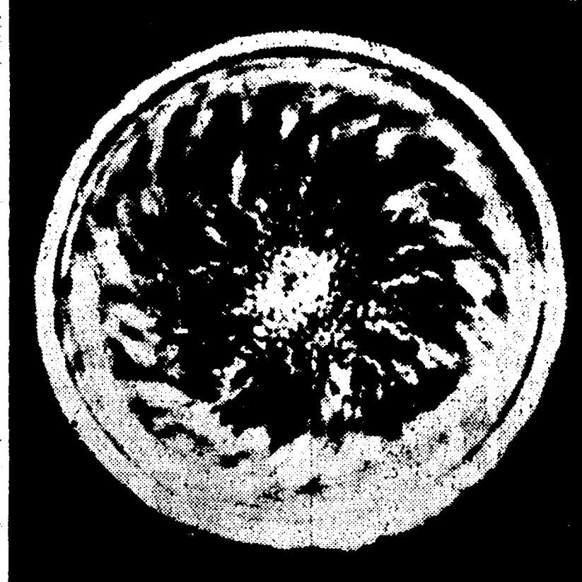
Questa è la foto ottenuta con la luce del Laser dal dottor Ascoli e Mazzucato: le sferette e gromeruli ben visibili sono vortici formati dal plasma in movimento.

una fotografia ottenuta nella notte di ieri pone in evidenza fenomeni mai osservati prima in 10 anni di ricerche sul « quarto stato della materia »