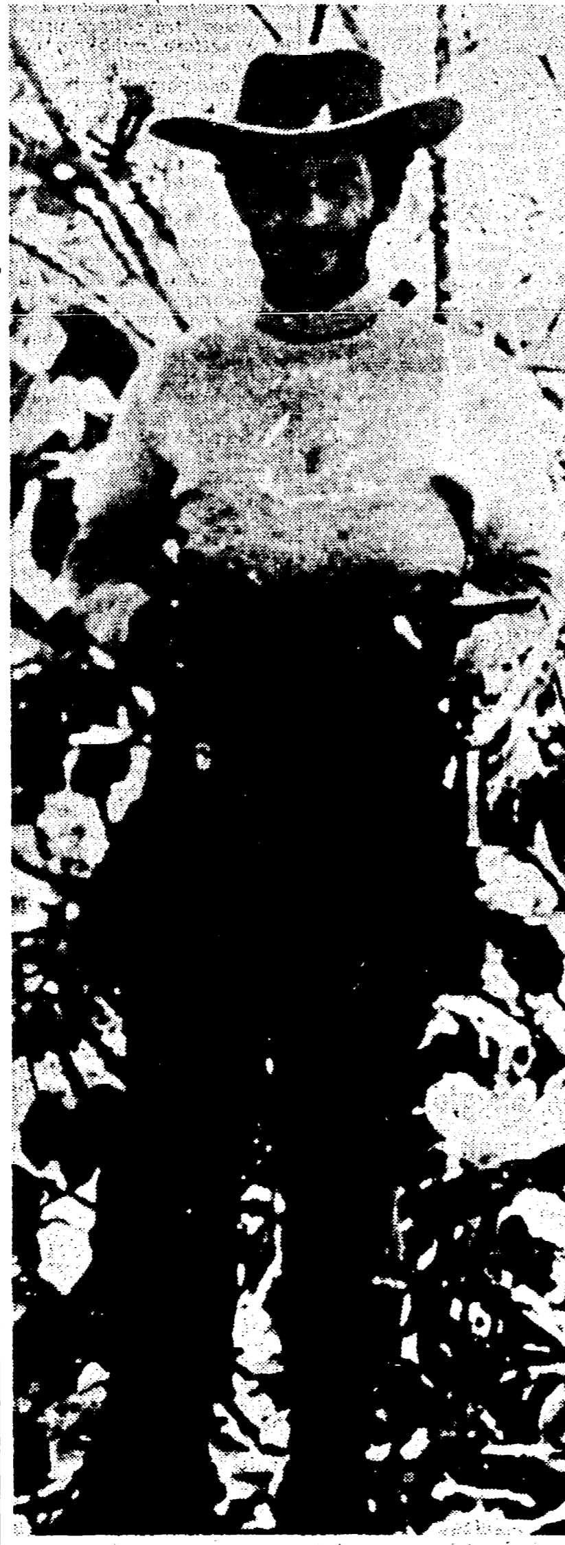
Nelle foto: guerriglieri delle formazioni delle FALN operanti nello Stato di Falcon, uno dei principali centri della lotta.