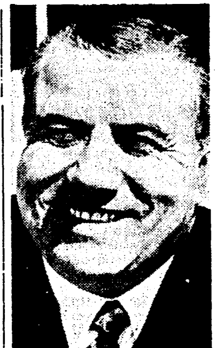
sviluppo (strade, ponti, dighe, oleodotti, industrie). Caldeggiava un'associazione economica interstatale fra Paesi medio-orientali modellata sul MEC. La sua morte avrà profonde ripercussioni nel mondo economico e politico del Medio Oriente. Nella foto AP: Emile Boustani.