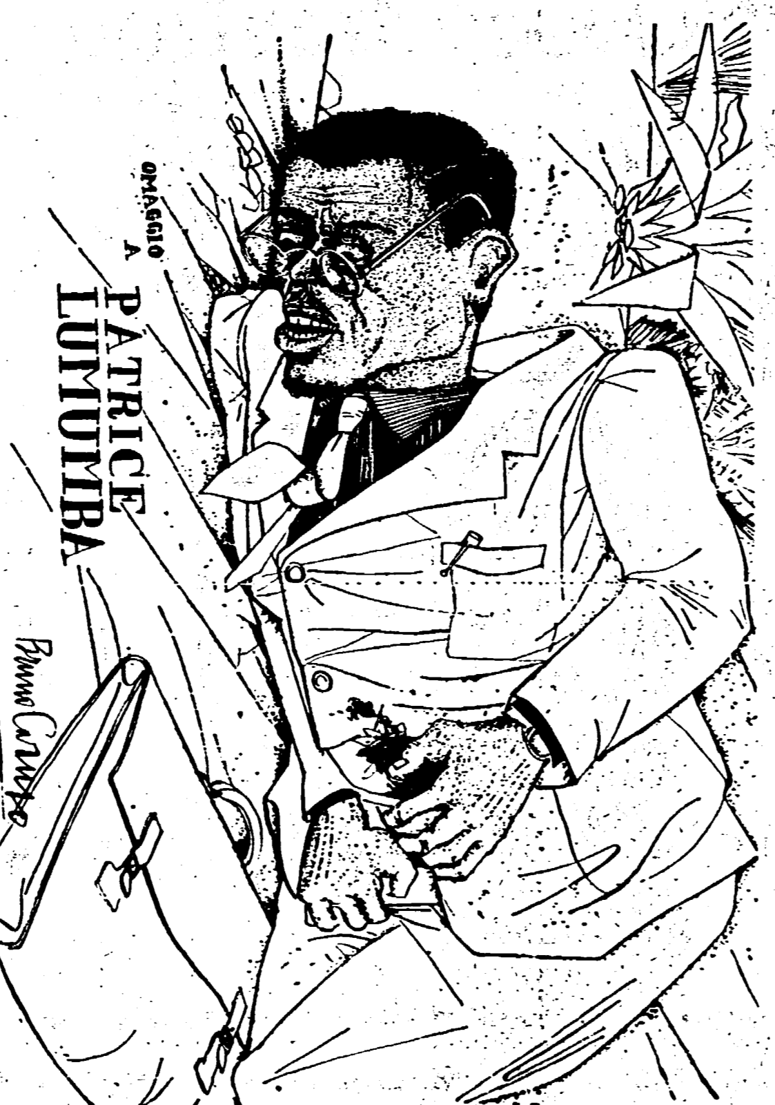
Disegno di Caruso PATRICE LUMUMBA

governato dal tiranno cattolico Salazar, le elezioni sono una tragica farsa. Tutti i candidati dell'opposizione sono infatti in esilio o in prigione. Delgado è stato costretto a rifugiarsi in Brasile. Vicente è stato condannato. In Angola e in Guinea — colonie portoghesi — centomila africani sono stati sterminati nel corso degli ultimi anni dalle truppe colonialiste portoghesi. Si è usato anche il napalm contro di loro.