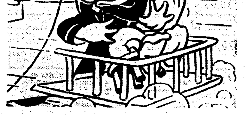
Torna Paperino nella serie «Disneyland», in onda sul secondo canale alle 21,15.