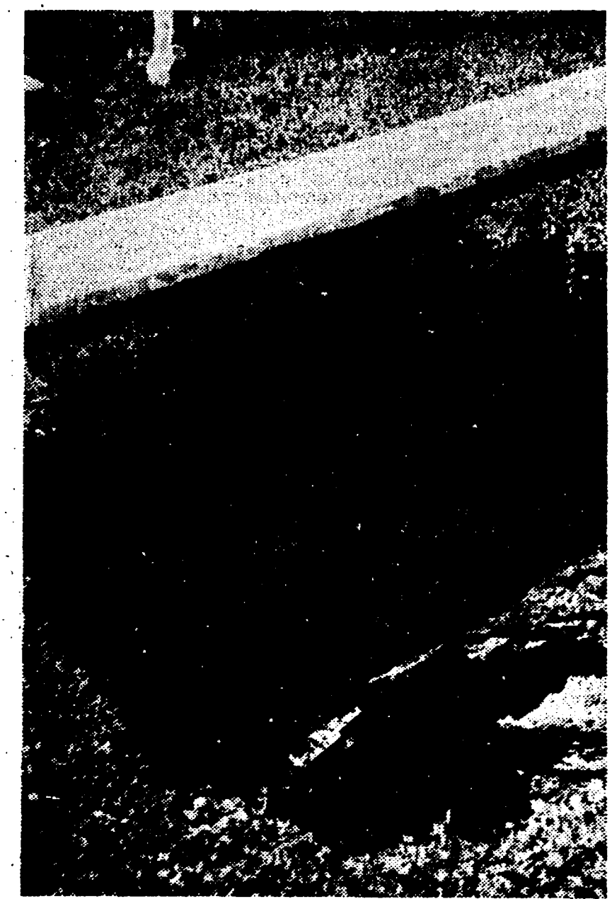
Una delle buche aperte sul terreno di gioco nel giugno 1960 pochi mesi dopo l'inaugurazione dello stadio.

Il Napoli non potrà giocare al «San Paolo» la partita con la Sampdoria se non saranno eseguiti i lavori di restauro — Il questore non concederà altre proroghe di «agibilità»