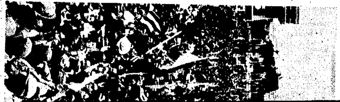
1969: Cuba, l'isola del socialismo, è stata liberata dalla rapina del monopolio imperialista e si è liberata dalla dipendenza e dalla garanzia l'indipendenza