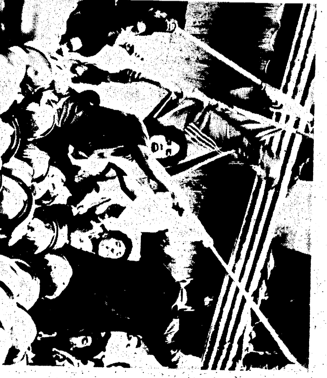
1962: l'Algeria, dopo sette anni di guerra sanguinosa, è proclamata Repubblica indipendente. Lo sterminio di massa in Algeria, le torture, tutto è stato messo in atto, ma inutilmente, per impedire agli algerini di conquistare la libertà