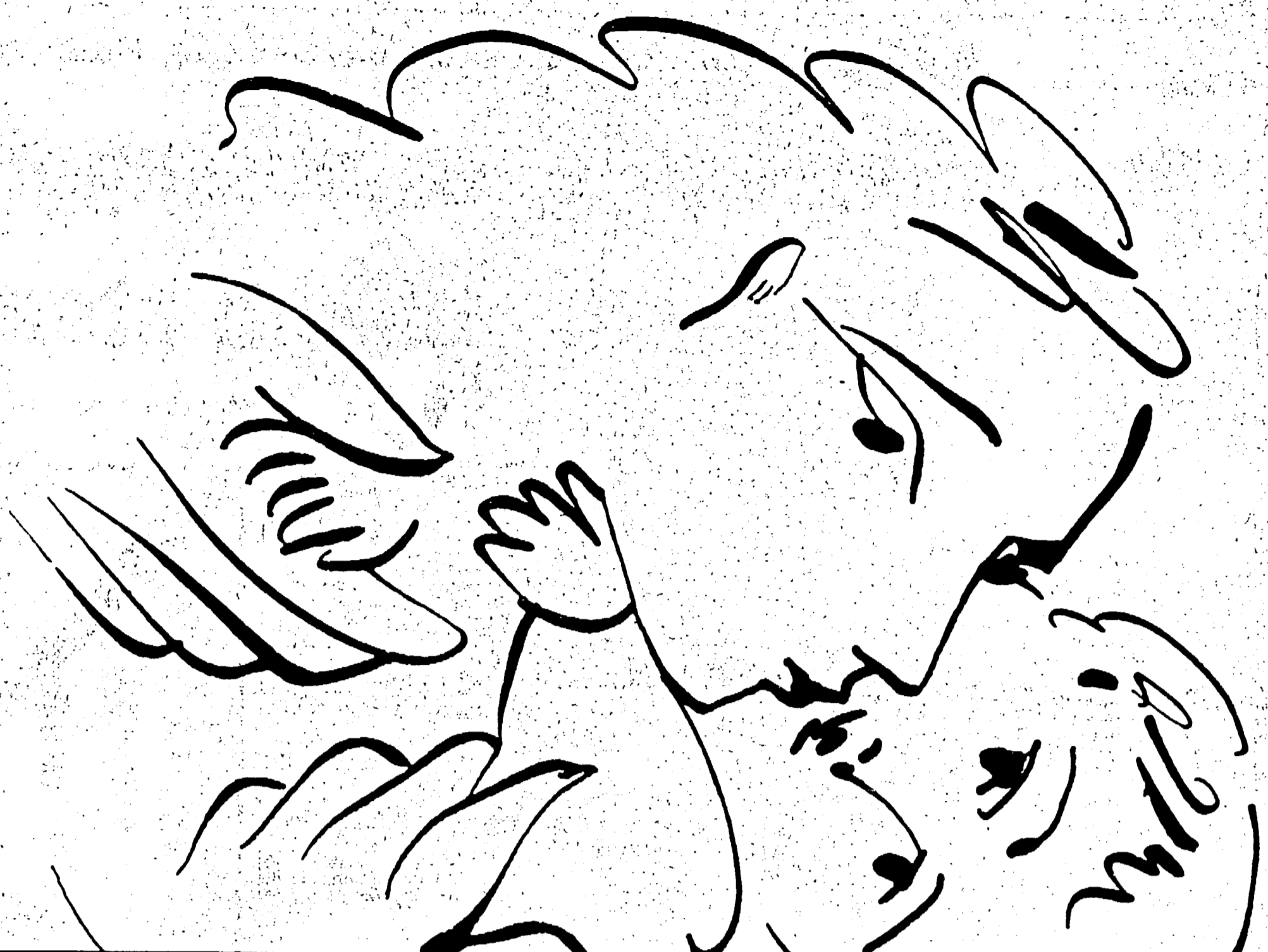
Disegno di Picasso

Il voto per il Partito comunista italiano è un voto per l'ideale che ha conquistato due miliardi di uomini. La nostra politica è comunista: i cam-... tu