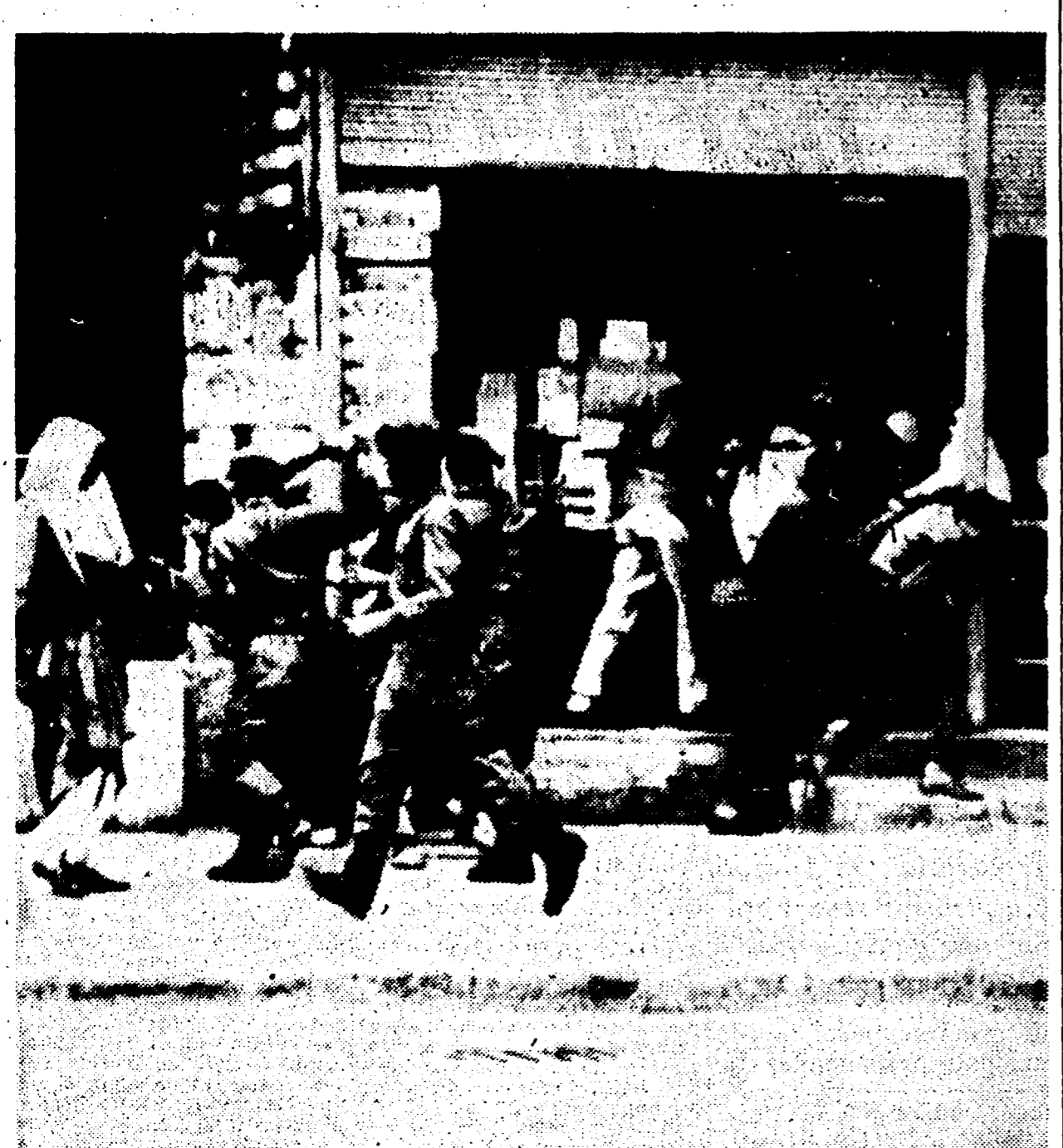
AMMAN — Truppe giordane bastonano alcuni dimostranti che manifestano al grido di « Hussein vattene »