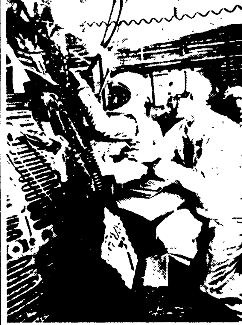
CAPE CANAVERAL — Cooper entra nella nave spaziale durante le ultimissime prove della vigilia.

Cooper potrà dormire per 8 ore. Sarà svegliato da un segnale inviato dalla stazione terrestre di controllo di Murcha (Australia) durante la 15a orbita. Per rimanere sveglio ha a disposizione pillole di De-cadrine e, per l'alimentazione, è fornito di cibi speciali equivalenti a 2.376 calorie. La capsula è di color arancione (facile ad essere individuato in mare), è munita di una telecamera, di speciali apparecchi fotografici, di un battello pneumatico con cassette di pronto soccorso, una piccola trasmittente, acqua potabile, cibo, fiammiferi, un fischietto, e una corda di nylon di 3 metri. Cooper è stato fornito anche di una siringa ipodermica con la quale potrà praticarsi una puntura anestetica in caso di incidente. Sono state pure date disposizioni per nascondere Cooper agli occhi dei fotografi e dei giornalisti, se al momento del recupero l'astronauta sarà ferito o malato. Una «fonte autorizzata» ha anche annunciato che gli Stati Uniti non esiteranno a iniziare trattative con il governo cinese qualora Cooper dovesse essere costretto ad atterrare in Cina.