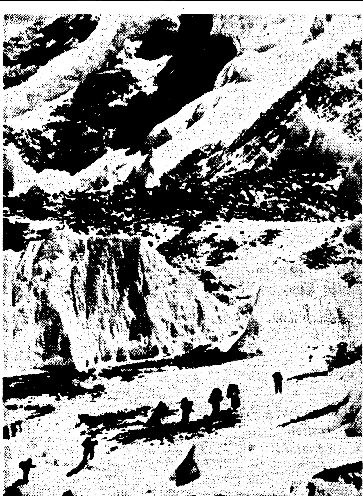
Una veduta dell'Everest.