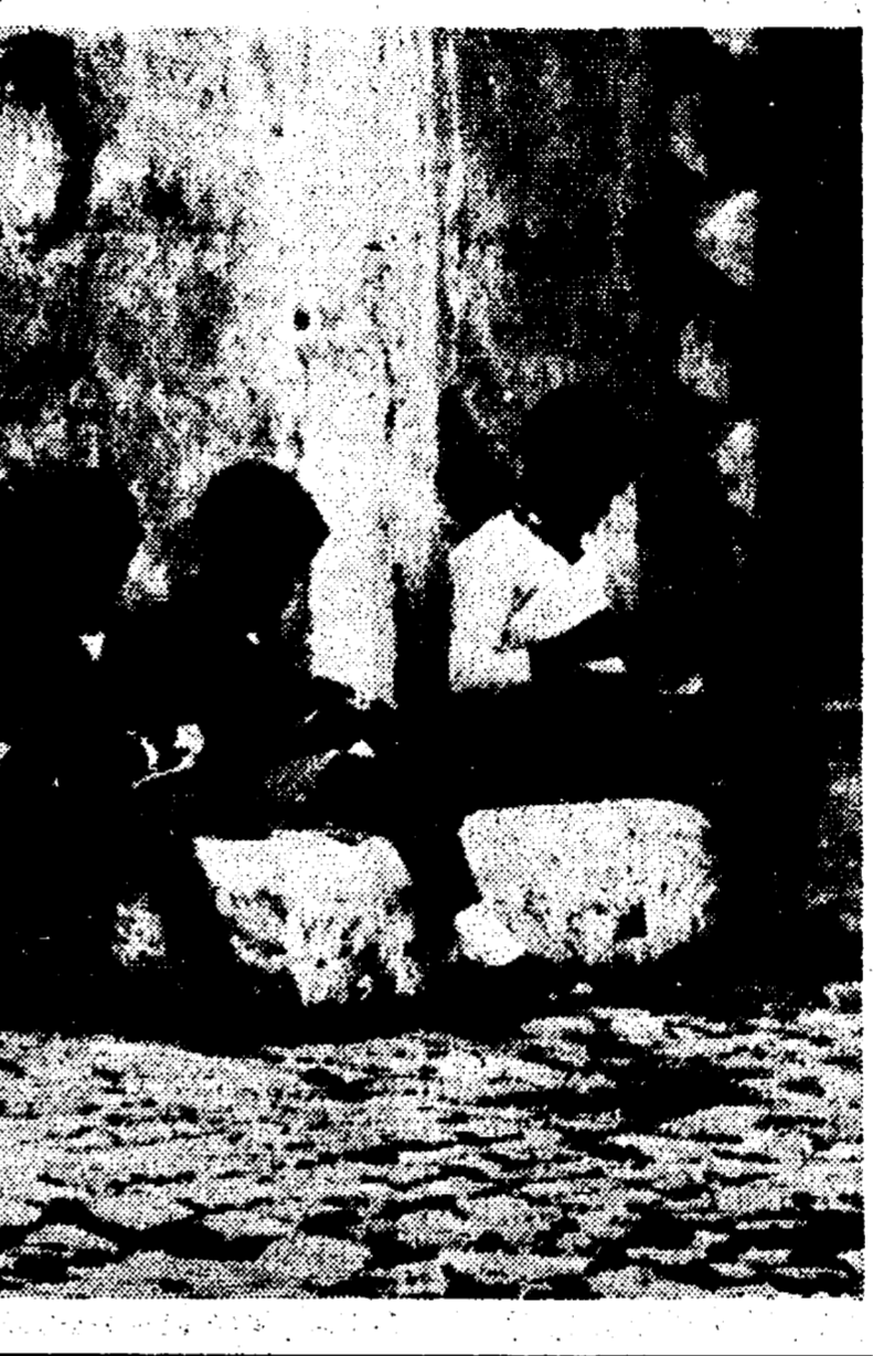
Dalla nostra redazione ANCONA, 30

L'Amministrazione comunale non ha mosso un dito per imprimere un aspetto diverso allo sviluppo urbanistico