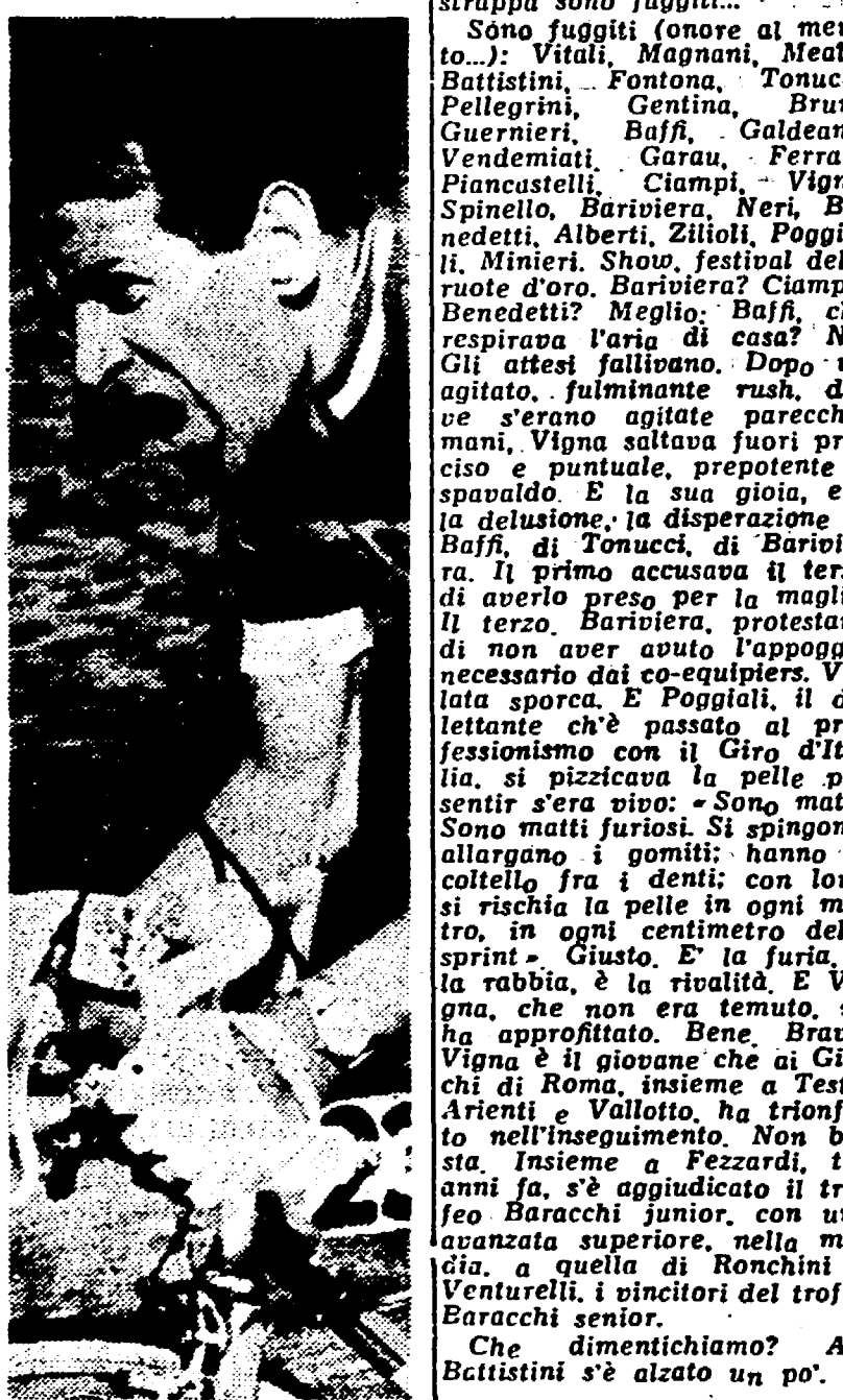
NENCINI si è ritirato