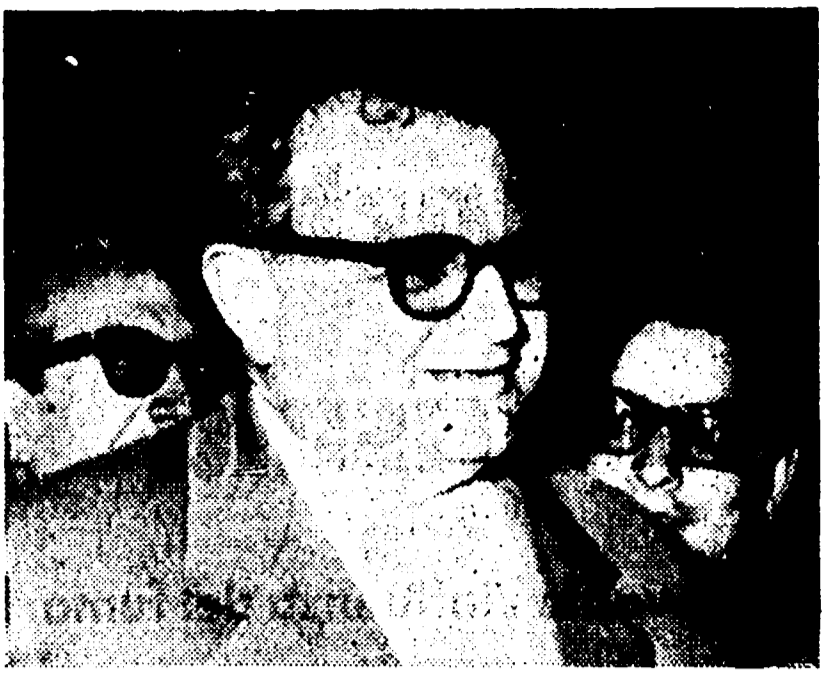
Il ministro Trabucchi