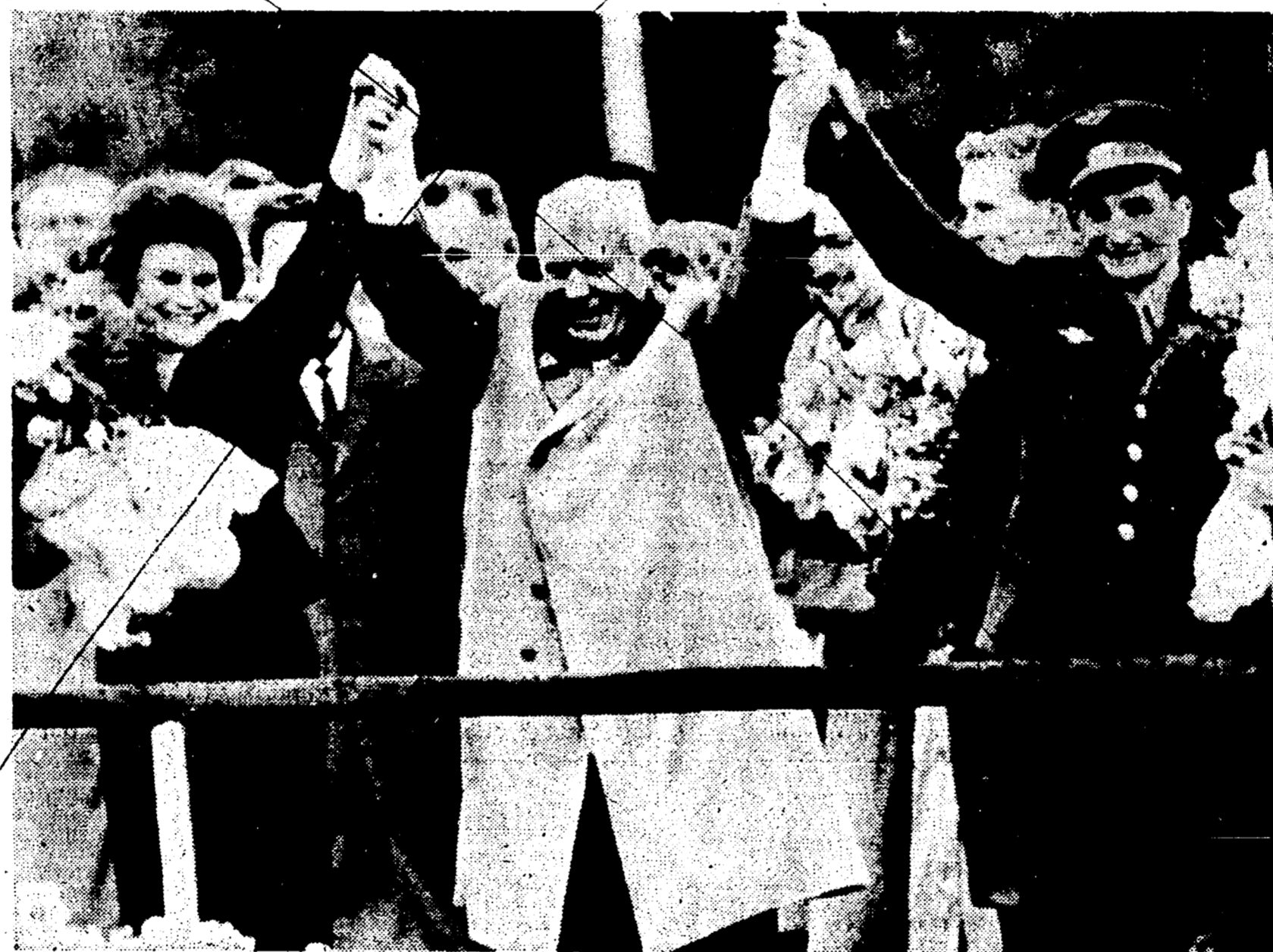
MOSCA — Krusciov solleva in alto il braccio di Valentina Teresckova e di Valeri Bykovski.

Davanti ai cosmonauti, ma soprattutto davanti a Valentina, si risvegliarono nella folla russa quei sentimenti elementari e profondissimi che hanno spesso avuto nella storia di questo paese straordinarie espressioni corali e che, nelle ore più difficili del suo passato, hanno costituito sempre una delle sue forze indomabili. Ogni donna al di sopra di una certa età si è sentita in questi giorni un po' madre di Valentina. Attorno alla madre vera vi è stata, durante la grande avventura cosmica della ragazza, una costante partecipazione popolare, come se l'URSS intera fosse stata un immenso villaggio dove con tutta naturalezza la famiglia di Valja era conosciuta da ognuno. «Auguro a chiunque di frasi che si sentivano ripetere abbastanza spesso. «Ho ancora poco da vivere: lascia che ti guardi», diceva una contadina anziana che era accorsa con gli altri, là sul prato dove Valentina è scesa dal cosmo. Ma tutto quello che i