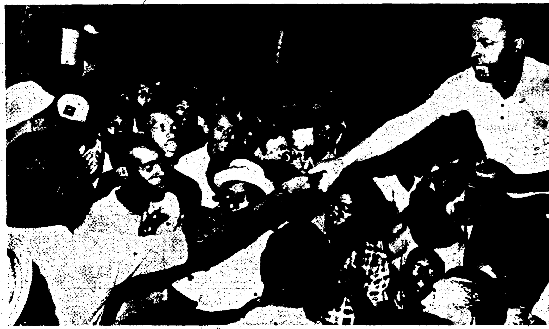
SAVANNAH (Georgia) — Il «leader» integrazionista Hosea Williams si è fatto promotore di una campagna per il riconoscimento dei diritti della gente di colore basata soprattutto su dimostrazioni di pacifismo e di moderazione. Ecco una: la consegna — da parte di centinaia di negri — d'ogni tipo di coltelli e armi od oggetti offensivi nelle sue mani.