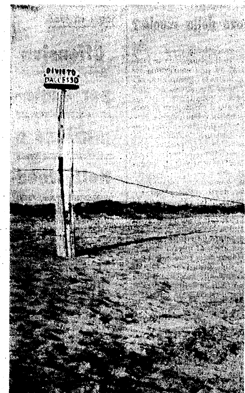
Al limite della tenuta di Castelporziano, dopo la nostra campagna contro il «mare in gabbia» e la successiva ordinanza della Capitaneria di porto, sono stati abbattuti i fili spinati. C'è rimasto, però, il cartello: «divieto di accesso».

Centinaia di lettere, giunte alla nostra redazione, testimoniano la validità della campagna sul «mare in gabbia». Alcune affrontano temi interessanti: l'attività dell'Ente provinciale del Turismo, la tutela del patrimonio paesaggistico, i prezzi praticati a Ostia. Ne pubblichiamo alcuni significativi stralci.