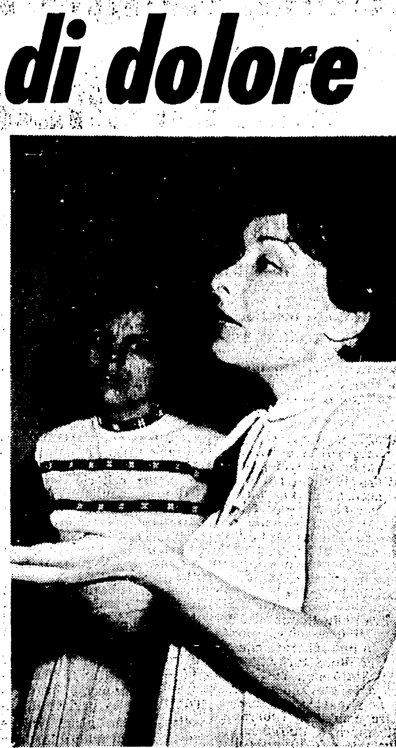
La signora portoghese che ha accolto i due piccini in casa sua subito dopo il dramma.

Su proposta del pro-sindaco Grisolia, la Giunta comunale ha approvato nella sua seduta di ieri l'elevazione della quota del reddito esente dalla imposta di famiglia e i criteri di applicazione della nuova imposta sulle aree fabbricabili. La Giunta afferma una nota capitolinea — ha riveduto la possibilità di accogliere la proposta del pro-sindaco tendente a migliorare il trattamento riservato ai redditi minori elevando la quota di reddito esente da 460 mila a 550 mila lire. Una richiesta tendente ad elevare la quota di abbattimento — della tassa di famiglia era stata avanzata dal PCI. Per le aree, la Giunta si ispira — a una seria applicazione della legge 5 marzo 1963 n. 246, che sarà integrata con successivi appositi provvedimenti. Le due proposte di deliberazione verranno prossimamente portate dinanzi al Consiglio comunale.