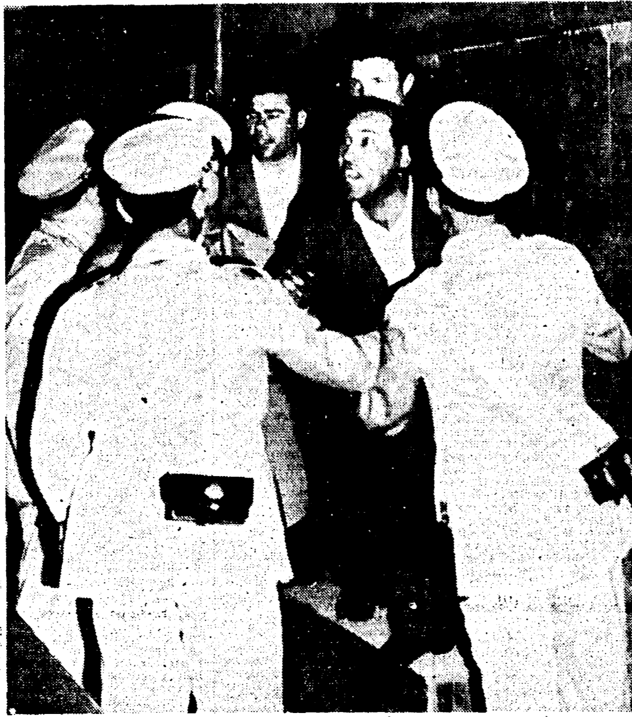
I gregari laici imprecano contro la conferma della loro condanna.