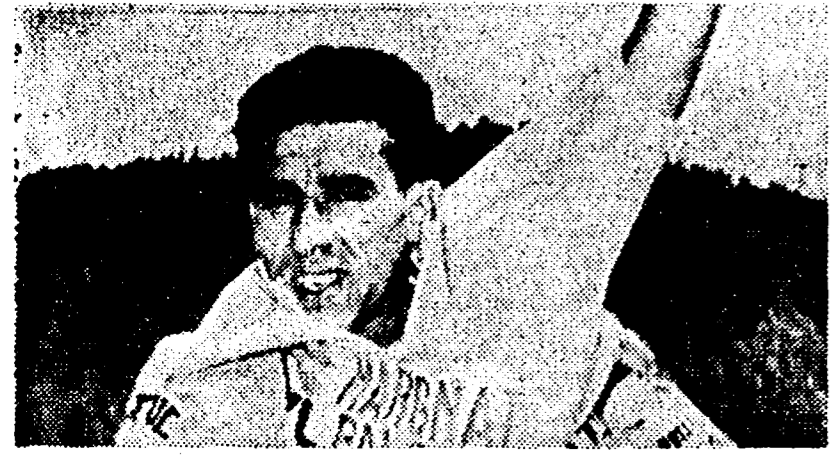
BAHAMONTES mentre indossa la maglia gialla.