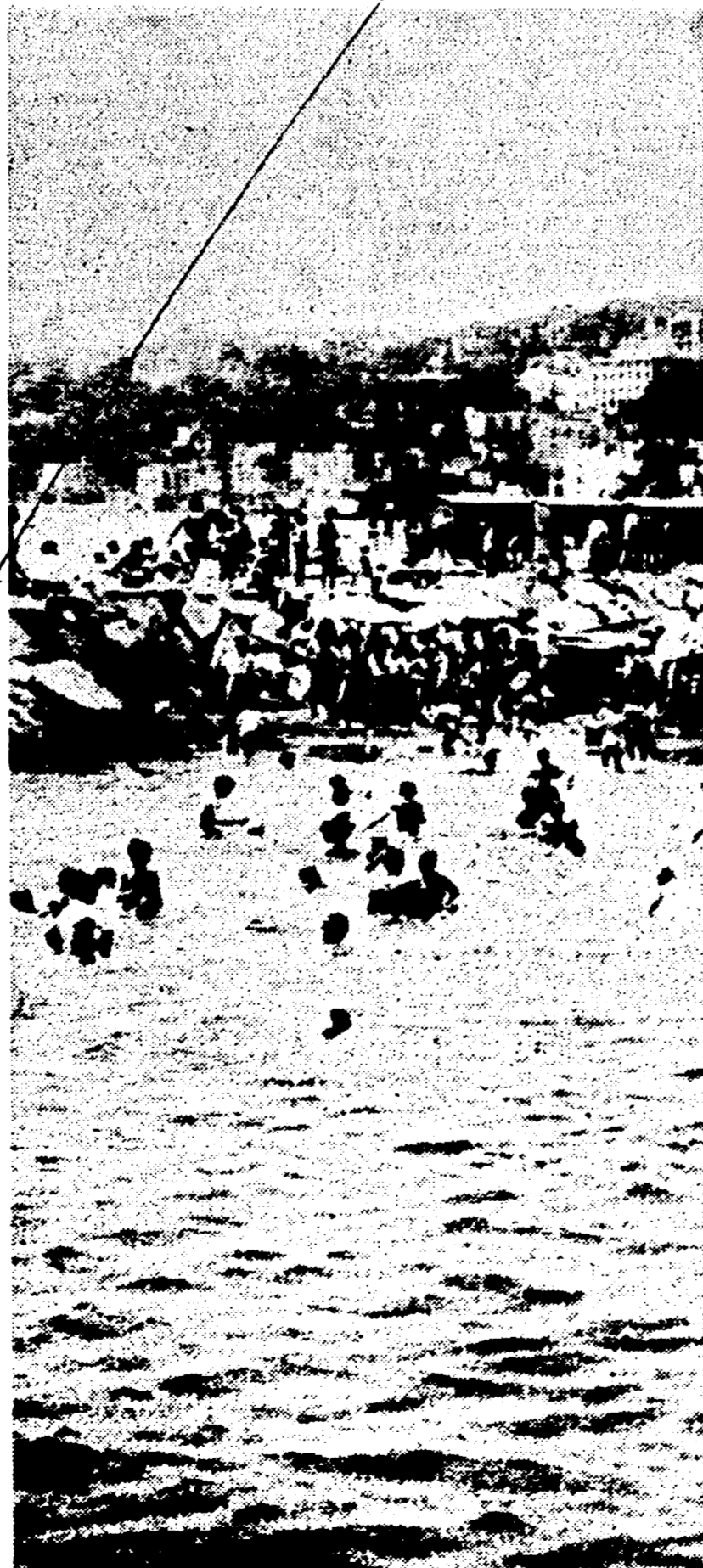
NAPOLI - Lo specchio d'acqua davanti alla rotonda di Mergellina affollato di bambini piovuti dai quartieri vicini

Basta chiedere attorno, girare un poco per scoprire ciò che i napoletani sanno ormai da tempo: che a Napoli non vi sono spiagge libere, luoghi dove una possa recarsi a prendere il bagno senza spendere molto. Lungo il litorale urbano le spiaggette sono poche, si contano sulle dita. Sono i « lidi mappatella » frequentati dai ragazzi dei ceti più poveri. La « mappatella », non è altro che il fagottello dei vestiti che vengono posati sulla sabbia e che un vecchietto custodisce dietro il compenso di cinquanta lire. I pochi metri quadrati di spiaggia sono coperti di cartacce, di scatolette, di rifiuti di ogni sorta. L'acqua è sporca in maniera indescribibile: due dita di acqua scaricata dalle navi galleggiano compatti come una crosta, pennellando di lordume la battigia. Ormai, ai « lidi mappatella » ci vanno solo gli spazzini e i poveri più poveri della città. Per i poveri meno poveri non c'è soluzione: il mare se lo devono guardare dalle spallette di via Caracciolo, a meno che non riescano a procurarsi i buoni del l'Eca per una ventina di