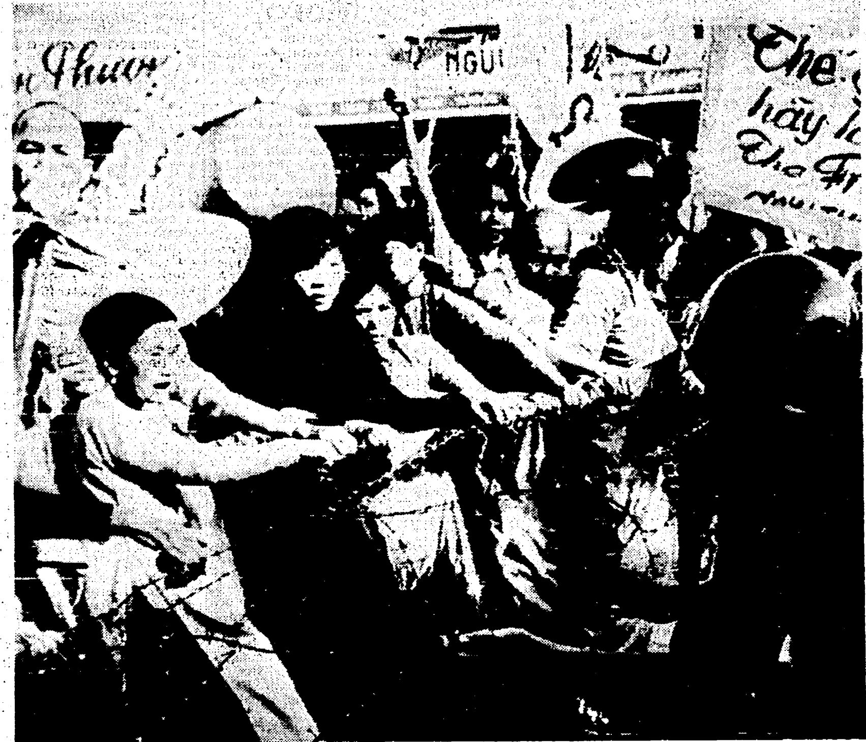
SAIGON — Decline di monache buddiste tentano di svenire con le mani gli sbarramenti di filo spinato eretti dalla polizia davanti alla pagoda di Xaol

Se non saranno accolte le richieste dei monaci, religiosi e fanciulli si suicideranno in pubblico