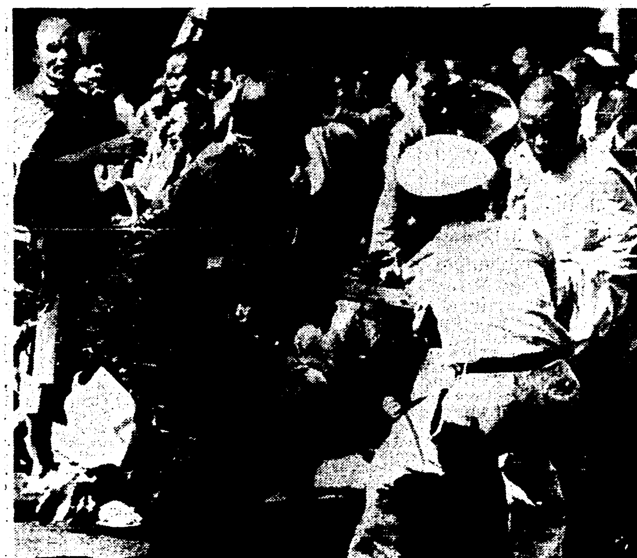
SAIGON — Un poliziotto e un ufficiale sollevano da terra un medico buddista tirandolo per la tunica

Frattanto all'interno della pagoda Giac Minh, davanti alla quale i partecipanti alle dimostrazioni odierne intendevano recarsi, prosegue lo sciopero della fame dei leaders buddisti. La polizia ha tentato di sbarazzarsi di filo spinato davanti all'edificio dove sostano anche carri armati e un triplice schieramento di poliziotti in assetto di guerra. Del pari è completamente circondata la zona intorno all'assemblea nazionale, teatro anch'essa di violenti scontri stamane. Davanti alla Camera si erano radunate moltissime giovani buddiste, alcune delle quali si sono lanciate con il loro corpo contro il filo spinato nel tentativo di superare gli sbarramenti. Ma le poche ragazze che sono riuscite a superare i caselli di frisa sono state bastonate e condotte in carcere.