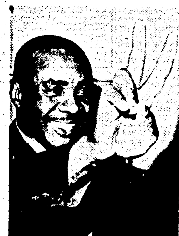
Liston è sicuro di battere anche Clay. Parlando di «grande bocca» Sonny ha detto: «Resisterà due riprese...»