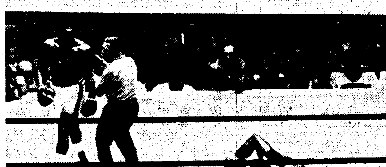
7072216-7/16/63-LAS VEGAS, NEV. - Floyd Patterson is shown in the photo going down for the final time during the phenomenal fight with Clay.