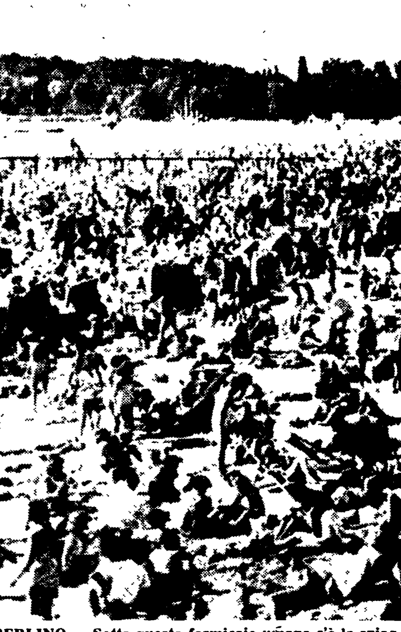
BERLINO — Sotto questo formale umano c'è la spiaggia del lago Wannsee; ma non ne rimane visibile nemmeno un metro quadrato. I berlinesi occidentali sono costretti a prender d'assalto il lago, che è una delle poche stazioni balneari accessibili a quanti non possono recarsi sulle spiagge italiane o francesi